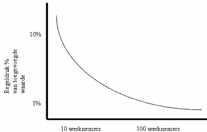
Figuur 1: Kleinbedrijf ondervindt relatief meer hinder van regeldruk (EIM)