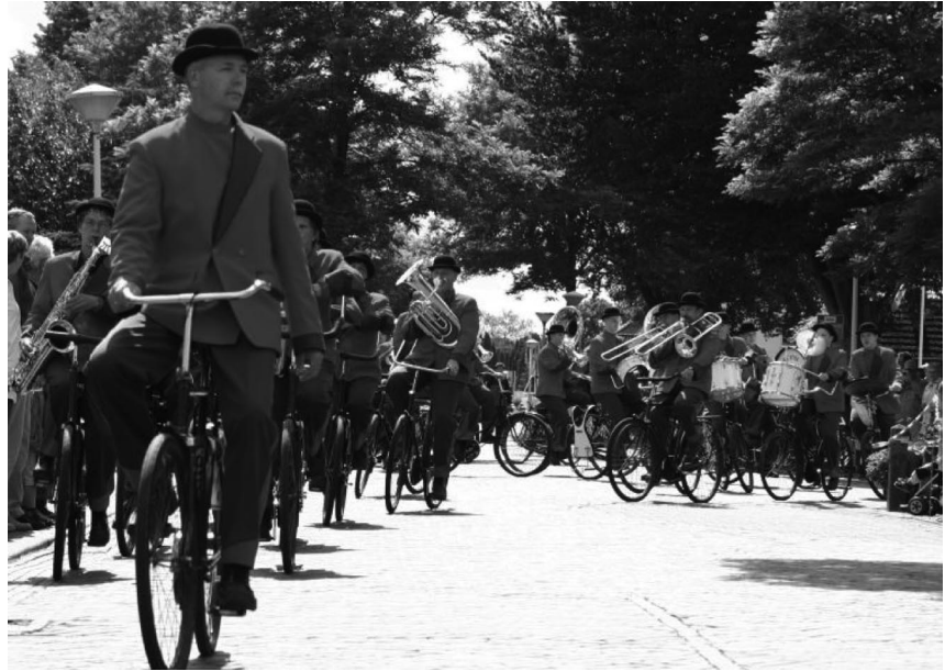
Het fietsende muzikpeloton van Crescendo uit Opende (Gr)