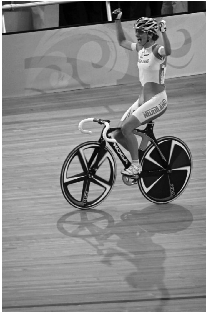
Marianne Vos wint Olympisch goud op de wielerveen in Beijing (2008). In 2010 worden in Apeldoorn de wereldkampioenschappen wielrennen op de baan georganiseerd.

Nederland is wereldwijd het belangrijkste fietsland. Prestaties in de wielersport ondersteunen dit beeld krachtig. Het positieve beeld kan verder worden versterkt door structureel in te zetten op de organisatie van grote en aansprekende fiets- en wielerevenementen.