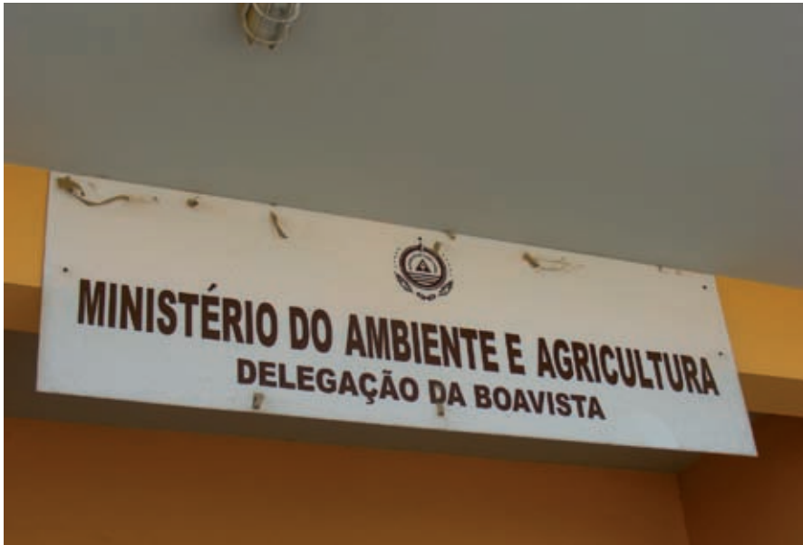
Kaapverdië: het ministerie voor Milieu en Landbouw, regionale kantoor van Boa Vista.