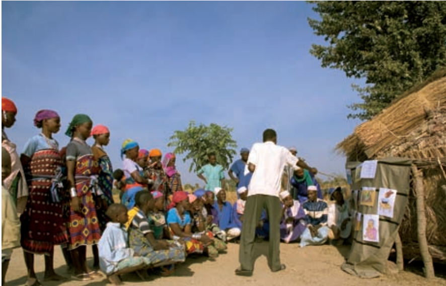
Benin: onderricht in schoon drinkwater, sanitatie en hygiëne.

tussen sectorale benadering en daadwerkelijke armoedebestrijding zijn niet positief. De voornaamste reden is dat micro-macro verbanden operationeel onvoldoende zijn uitgewerkt. Veel energie is gericht op het in gang zetten van de nieuwe omgangsvormen, die onderdeel zijn van de sectorale benadering: donoroverleg, resultaatraamwerken en begrotingsfinanciering. Maar het gevolg is dat eindresultaten niet altijd meer in beeld zijn.