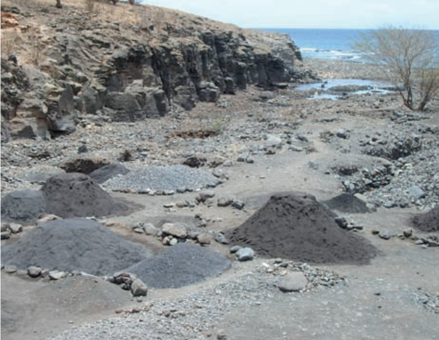
Kaapverdië: zandwinning: onderwerp van politieke discussie.

Ook bevorderden deze onderhandelingen informele ontmoetingen tussen verschillende spelers in de sector. Zo werden in Kaapverdië plannen voor een jachthaven in een kwetsbaar marine natuurgebied opgeschort, nadat het ministerie van Economische Zaken geïnformeerd werd over schade aan milieuwaarden. Ook was het in dit land mogelijk om maatregelen tegen het afkalven van stranden door illegale zandwinning voor de bouwindustrie aan de orde te stellen, zoals het stimuleren van alternatieven (zand import uit Mauritanië) of belastingsmaatregelen (belasting voor aannemers). In Vietnam veranderde de oriëntatie van het bosbouwbeleid: van een grote aandacht op productie doelstellingen naar gemeenschapsbossen en de uitgifte van eigendomsrechten zodat lokale bewoners een direct belang kregen in bosbeheer.