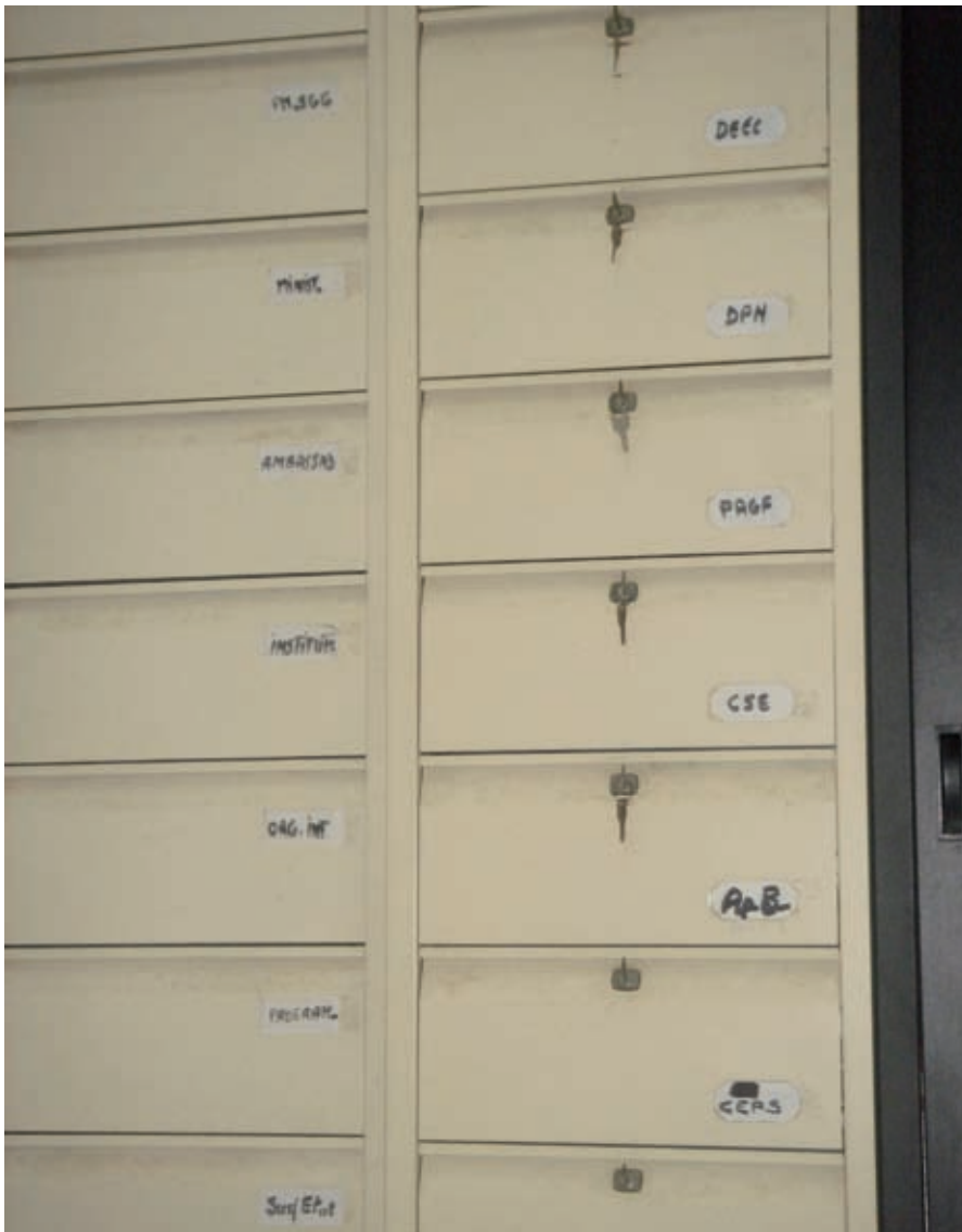
Senegal: in de archieven van het ministerie is het dossier begrotingssteun (ApB) opgeslagen tussen de projectdossiers.

programma afgebouwd. In de nieuwe overeenkomst tussen Nederland en Senegal werd een maximum bedrag van EUR 67,5 miljoen afgesproken voor de periode 2005-2009. In principe bestaat deze bijdrage uit een vaste allocatie van EUR 7,5 miljoen jaarlijks en een variabele allocatie, die afhankelijk is van de score op vastgestelde indicatoren in het resultatenraamwerk voor milieu. Als onderdeel van de overeenkomst is een strategische planning afdeling opgezet in het ministerie van