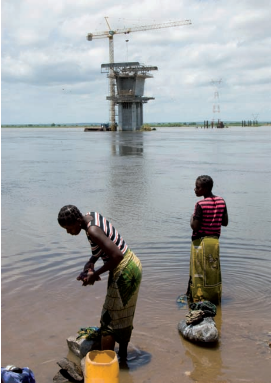
Mozambique: vrouwen doen de was met op de achtergrond de eerste peiler van de in aanbouw zijnde Zambezibrug. De brug wordt gefinancierd door o.a. de EU en Zweden.