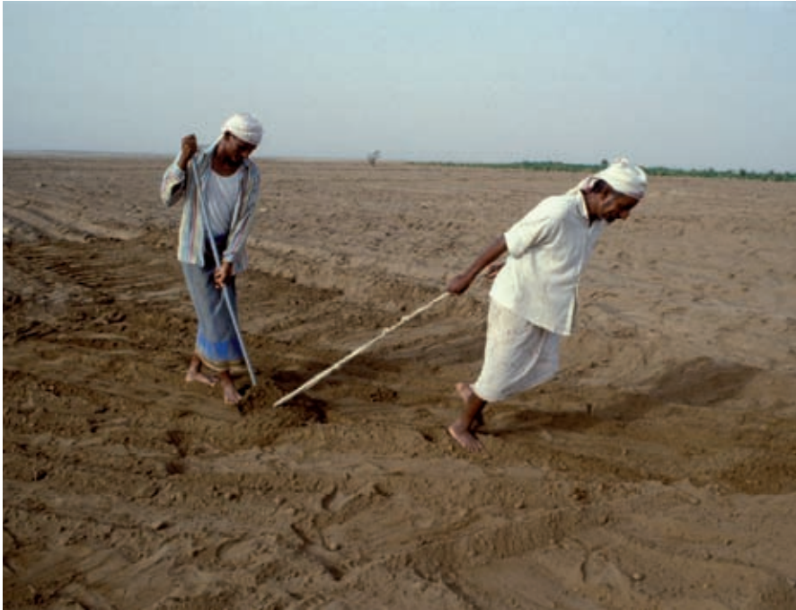
Jemen Al Hodayday: Egaliseren van de grond zodat irrigatie gelijkmatiger in de grond kan dringen.

drinkwaterprogramma in de Dhamar regio werd opgezet, wat tot in de jaren negentig over vijf fasen doorliep. Gaandeweg werd ook een omvangrijk programma in waterbeheer geformuleerd met grondwaterstudies en ondersteuning aan de bovengenoemde Nationale Water Autoriteit. In deze periode vond alle hulp plaats onder de project modaliteit. Vanwege de slechte politieke en bestuurlijke situatie werd de hulp rond 2002 met één derde teruggebracht en werd zelfs overwogen die ondersteuning aan de watersector te stoppen.