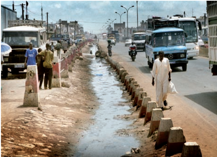
Dakar, Senegal: open riool.

De totale hulp voor de watersector in de periode 1998-2006 bedraagt EUR 313 miljoen. Figuur 1.2 laat zien dat de uitgaven voor water terugliepen in de periode 2000-2004, maar daarna weer opliepen om in 2006 het niveau van 1998-1999 te bereiken. Een reden voor deze daling is de vermindering van middelen voor de bilaterale hulp. Ter gelegenheid van het Wereld Water Forum van 2000, dat in Nederland werd gehouden, beloofde Nederland een extra financiële bijdrage voor waterbeheer van EUR 45 miljoen per jaar. Daarnaast was de hierboven genoemde afspraak om extra bij te dragen aan de MDG doelstellingen op het gebied van drinkwater en sanitaire voorzieningen een reden voor toename van de middelen voor water. Daardoor zijn de totale uitgaven aan de watersector in de periode 2004-2006 in vergelijking met de voorgaande periode weer wat toegenomen en bedroegen EUR 411 miljoen. 16