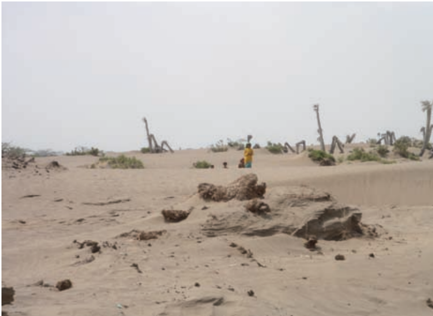
Jemen: droogte.

gebied, die niet alleen op sectorniveau konden worden opgelost. De voorstellen om in de milieu- en watersector de sectorale benadering toe te passen zou juist goede mogelijkheden bieden om genoemde beperkingen te verhelpen en tot een bredere en meer samenhangende aanpak van de problemen te komen. Sectorale benadering leek bovendien goed aan te sluiten bij het hiervoor genoemde concept van geïntegreerd waterbeheer, die immers aanzette om de problemen van de sector in onderlinge samenhang aan te pakken.