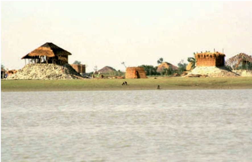
Bangladesh: projectsteun voor armoedebestrijding: Nederlandse steun voor de bewoners van de buitendijkse gronden (Charlands).

om dit te bewerkstelligen zijn gewoonlijk zwak ontwikkeld: gespecialiseerde onderhoudsbedrijfjes of reserve onderdelen zijn in afgelegen plattelandsgebieden vaak niet voor handen. Dit maakt de duurzaamheid van deze voorzieningen onzeker.