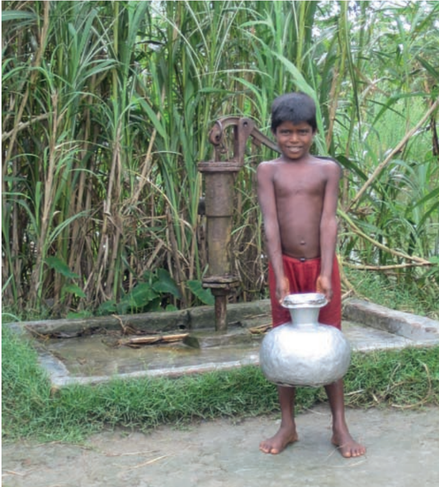
Bangladesh: drinkwater.

Bangladesh is een van de dichtstbevolkte landen, gelegen in de delta van twee van de werelds grootste rivieren. Tijdens de moesson is er sprake van grote wateroverlast met overstromingen, die soms meer dan de helft van het land treffen, terwijl er tevens een watertekort voor de landbouw is in de periode erna. De overstromingen hebben twee kanten, want ze brengen behalve schade tegelijkertijd ook vruchtbaar slib. Aan de kust wordt het land regelmatig getroffen door cyclonen. De overheid probeert woningen en wegen te beschermen tegen wateroverlast, maar Bangladesh is eenvoudigweg te arm om grootschalige infrastructuur aan te leggen en te onderhouden. Drinkwatervoorzieningen in Bangladesh hebben sinds de jaren negentig te kampen met een bijzonder probleem: een hoog arsenicum gehalte, dat in verband wordt gebracht met intensief grondwater gebruik.