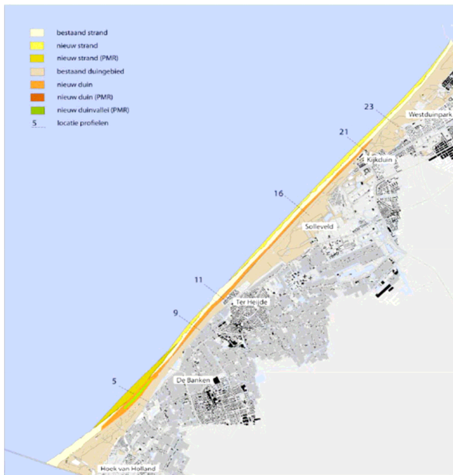
Figuur 1: locatie duincompensatie en zwakke schakel Delfland.

Onderstaande figuur 1 laat de locatie zien waar de duincompensatie in combinatie met de versterking van de zwakke schakel Delfland wordt aangelegd.