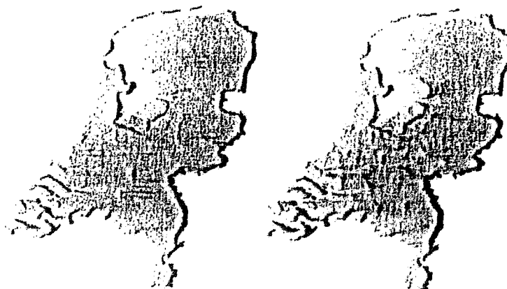
Stichting Philadelphia Zorg - Fase 1