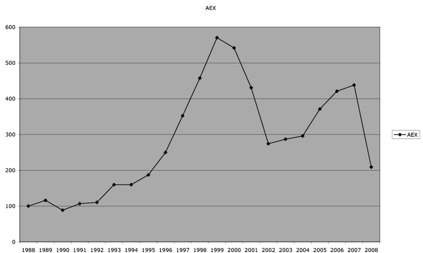
Grafiek 1: AEX index (1988=100)

In de onderzochte periode heeft de index twee toppen gekend: in 1999 en 2007. Daartegenover staan in de onderzochte periode een dal in 2002 en een sterke daling in 2008. De rendementen van jaar op jaar fluctueren dan ook sterk. In de jaren 1999 en 2005 werden rendementen gehaald van 30%, terwijl in 2001, 2002 en 2008 het rendement sterk negatief was. Als het rendement over tien jaar wordt gemiddeld, ontstaat een minder wisselend beeld. Dan blijkt het gemiddelde jaarrendement af te nemen en over de periode 1998–2008 zelfs negatief te worden.