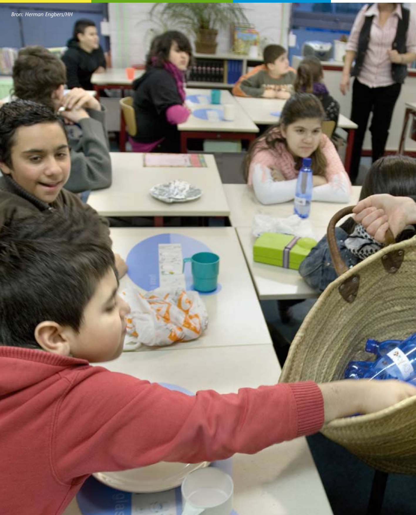
Ontbijtles op basisschool