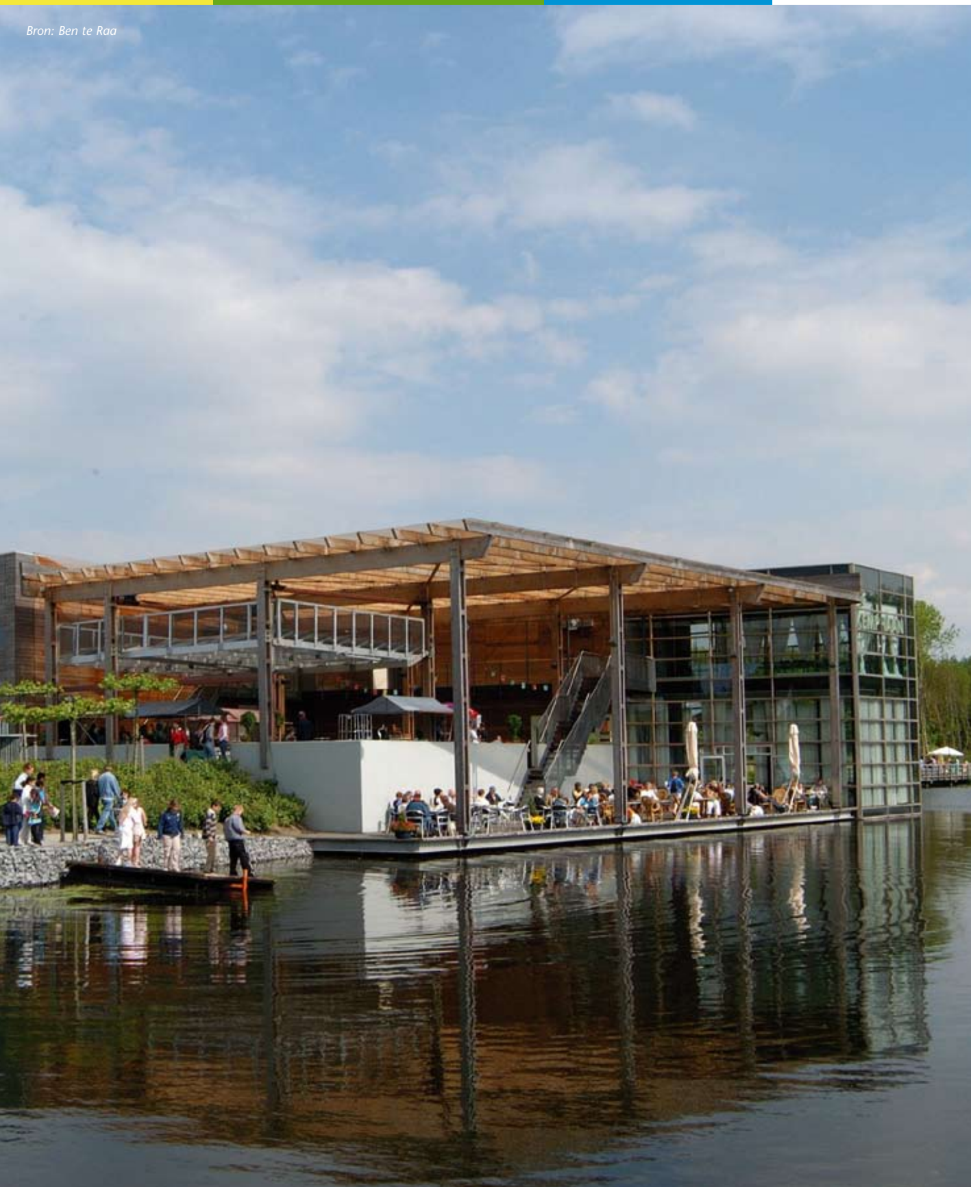
Stadslandgoed De Kemphaan in Almere

Duurzaamheid wordt nogal eens gebruikt als argument om voor regionaal of lokaal voedsel te kiezen. Tegelijkertijd lijkt 'regionaal' of 'lokaal' een waarde op zichzelf te worden. Daarbij wordt waarde gehecht aan duurzaamheid maar ook aan het weten waar het voedsel vandaan komt en zich daarmee kunnen identificeren, zich verantwoordelijk voelen of thuis voelen. 50