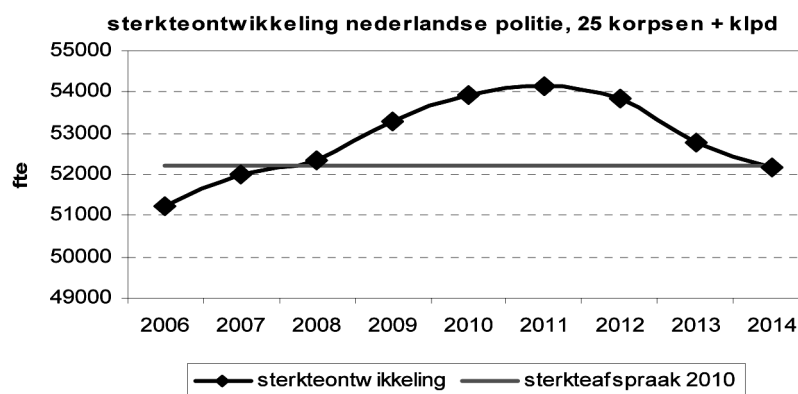
Figuur 2: bron PolBis en Expertisecentrum Personeelsvoorziening Politie