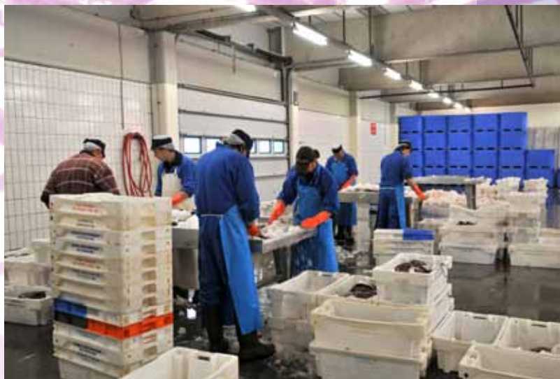
Visafslag in Lauwersoog

De vermarkting van producten uit de Waddenzee kan beter: men is nu nog teveel gericht op kwantiteit in plaats van kwaliteit. Er wordt te weinig gebruik gemaakt van het feit dat producten uit het bijzondere Waddengebied een hoge waarde voor de consument kunnen hebben. Meer aandacht voor de kwaliteit en diversiteit van de producten en voor de mogelijkheden van vermarkting van deze producten, is nodig. Bovendien leggen de producten van zee naar consument een lange weg af via teveel schakels. Dat kan efficiënter. Vissers zouden hogere en stabilere prijzen voor hun vis moeten kunnen krijgen door gebruik te maken van nichemarkten (dus: specifieke en