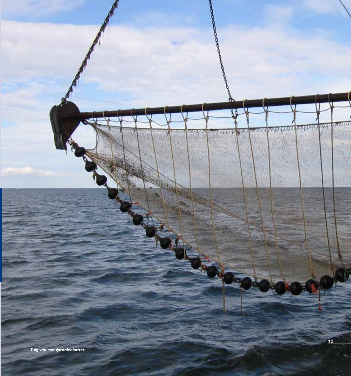
Tuig van een garnalenkotter