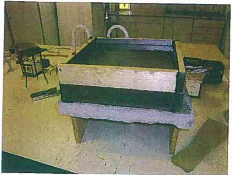
Foto 2 Vochtige plekken in de zand-cementvloer.