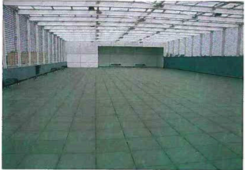
Foto 2 Overzicht aansluiting dakrand bij opstand.