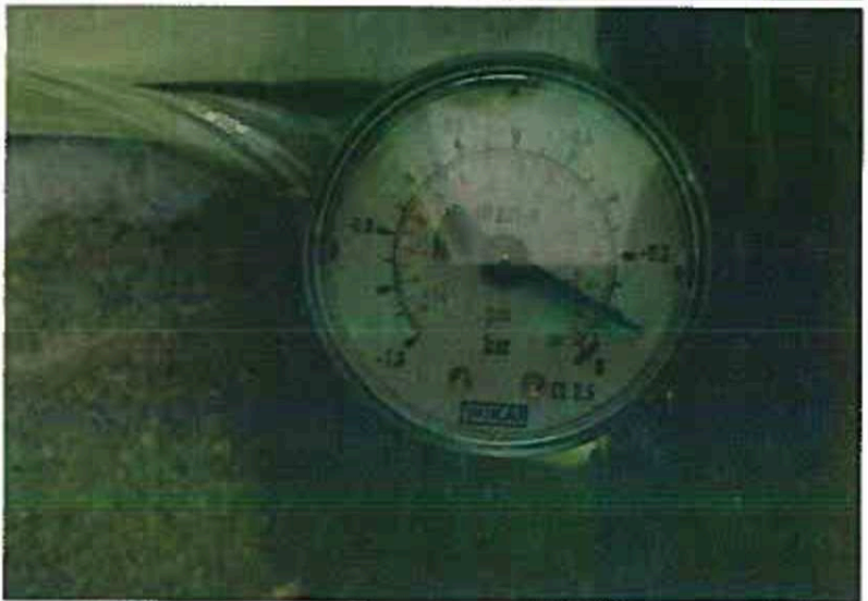
Foto 6 Grove belvorming bij circa -0,4 bar.