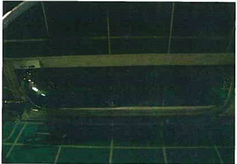
Foto 11 Belvorming bij perforaties in het voegwerk.

Foto 10 Overzicht opstelling test voegen van wandtegels.