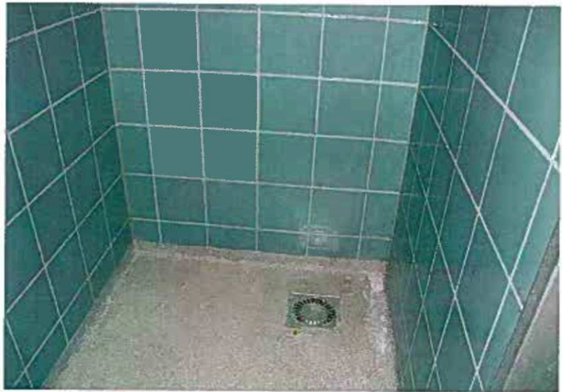
Foto 2 De Duracrylvloer vertoont bij de aansluiting met de afvoerput roestvorming.

Foto 1 Overzicht van een natte gedeelte van een cel.