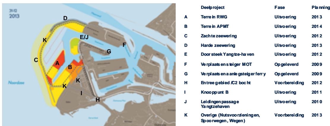
Figuur 1: Overzichtskarta belangrijkste deelprojecten Aanleg Maasvlakte 2 Eerste fase

De relevante highlights en/of kritieke milestones in de afgelopen rapportageperiode zijn geweest (zie voor de deelprojecten ook de overzichtskarta hierboven):