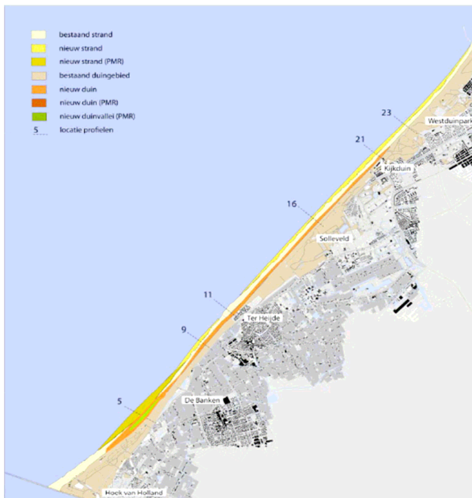
Figuur 1: Locatie duincompensatie Delflandse Kust en zwakke schakel Delfland.

Onderstaande figuur 1 laat de locatie zien waar de duincompensatie in combinatie met de versterking van de zwakke schakel Delfland zijn aangelegd.