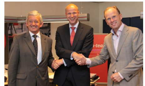
Minister van Middelkoop, algemeen directeur Tempo-Team de heer Stroomer en de Rotterdamse wethouder Schrijver na ondertekening van het landelijk convenant over de inzet van Tempo-Team in de wijken en een intentieverklaring over de lokale Rotterdamse invulling daarvan op 28 juli 2010.

13.000 Rotterdammers over de veiligheid in hun buurt. De Veiligheidsindex geeft aan dat er afgelopen jaar voor het eerst geen 'onveilige' wijken meer zijn in Rotterdam. De score is gestegen van 7,2 naar 7,3.