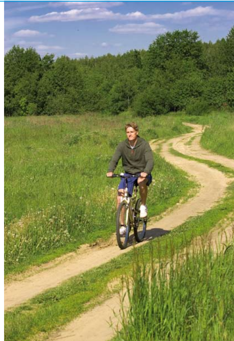
Recreanten zijn maar weinig geïnteresseerd in de soortenrijkdom

“Wijzen op de keuzes die gemaakt kunnen worden. Wat is het doel op langere termijn en welke beleidsgevolgen heeft dat? Nu lopen verschillende benaderingswijzen vaak door elkaar. Aan de ene kant heb je de puur ethische benadering,