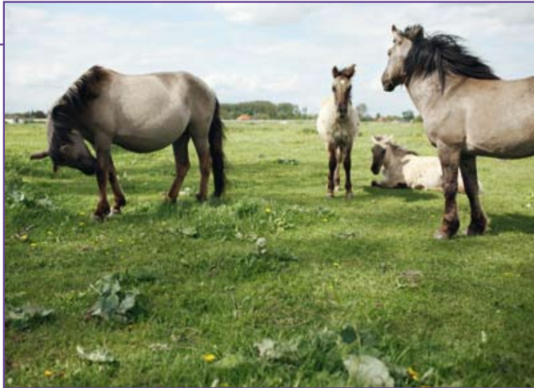
Konikpaarden in Roosteren

'Boeren die we willen ondersteunen, verwelkomen ons niet altijd met koffie en vlaai'