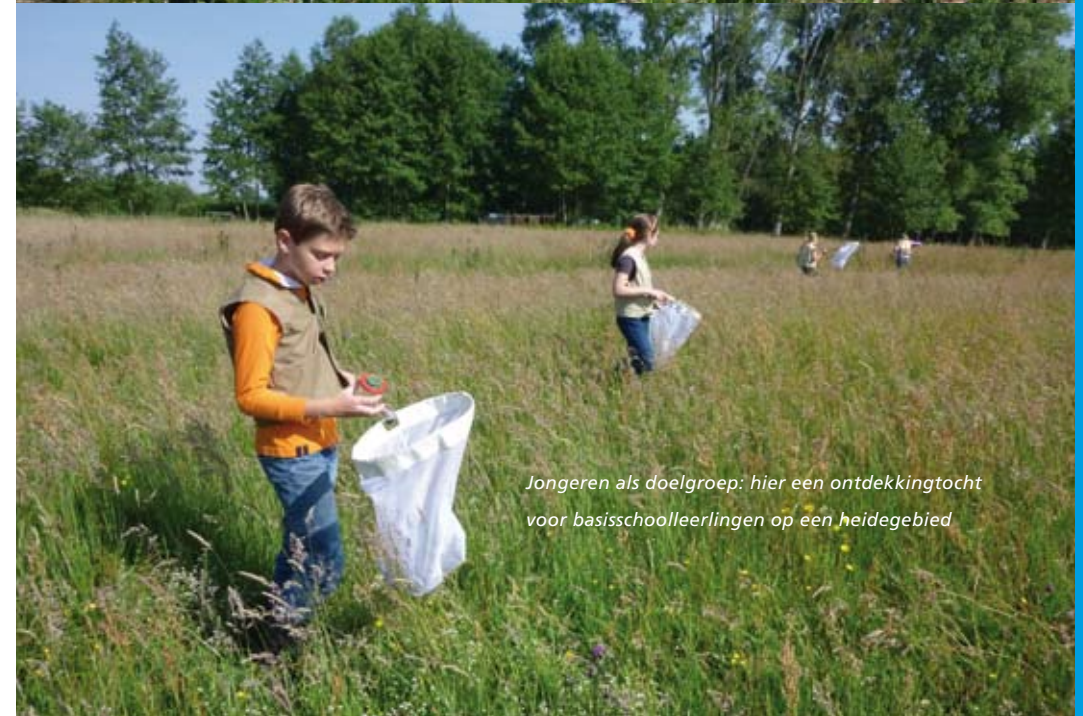
Jongeren als doelgroep: hier een ontdekkingsocht voor basisschoolleerlingen op een heidegebied