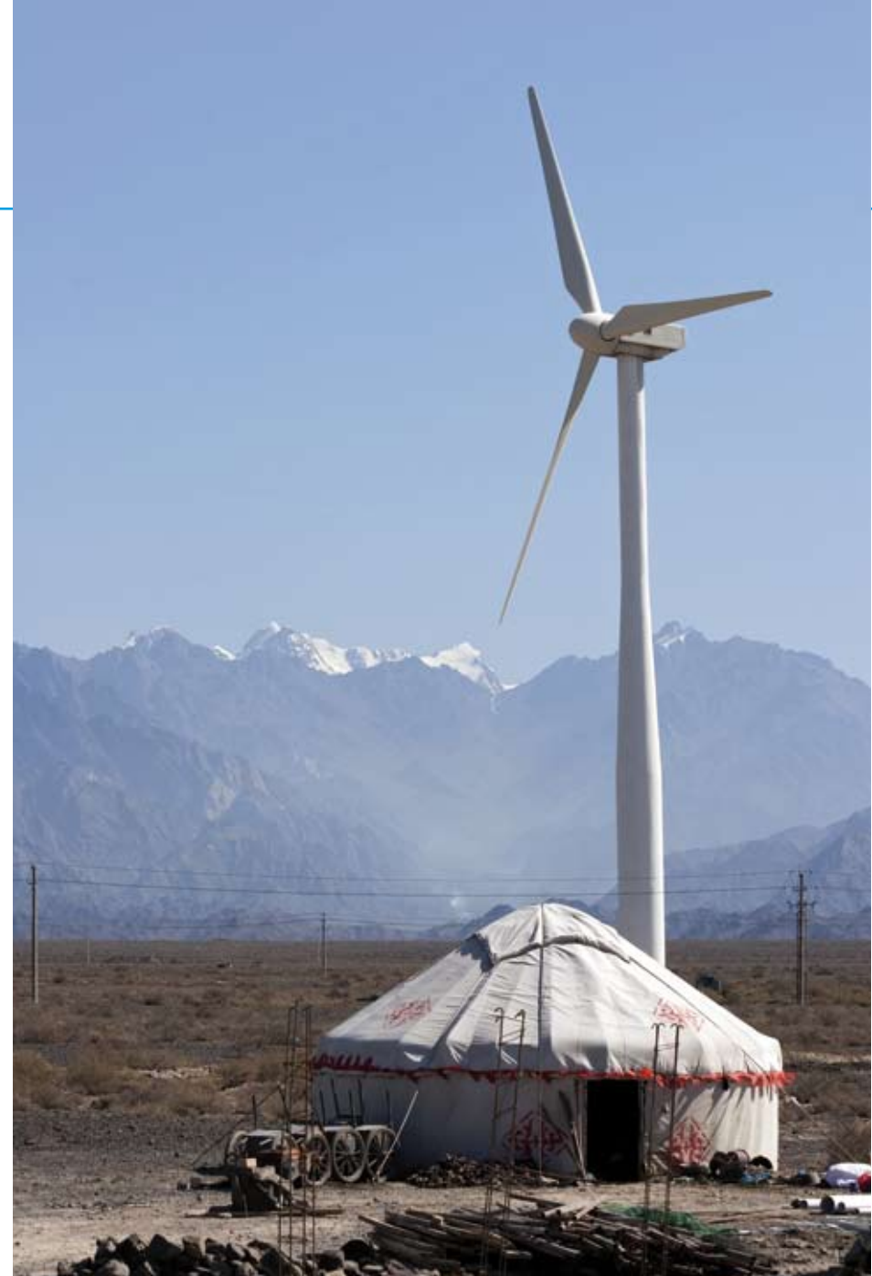
China en India kunnen hun energievoorziening meteen een stuk duurzamer maken

"Misschien niet zo publiekelijk. Mijn collega-ministers Gerda Verburg (Landbouw, Natuur en Voedselkwaliteit) en Bert Koenders (Ontwikkelingssamenwerking) waren de trekkers van dit onderwerp. Maar achter de schermen heb