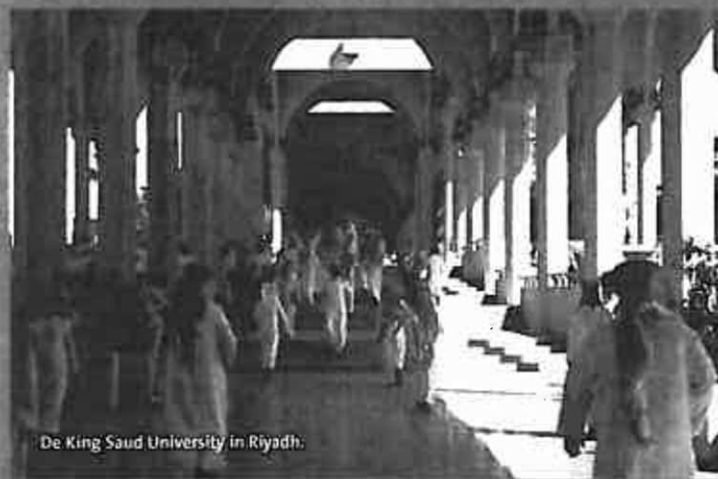
De King Saud University in Riyadh.

De universiteiten van Maastricht en Groningen plaatsen zelfs gezamenlijk een hogeronderwijs-attaché op de ambassade van Riyadh, Saoedi-Arabië.