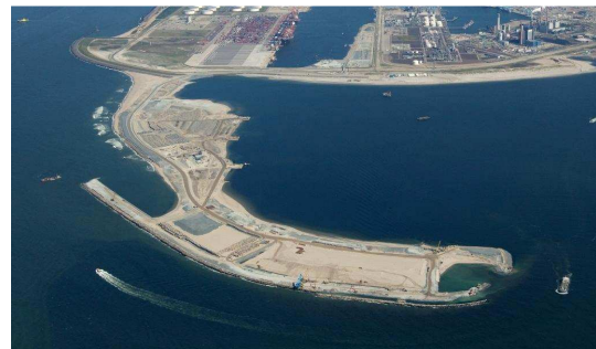
Figuur 5: Luchtfoto Zeewering in aanleg (juli 2011)

In de geldende vergunningvoorwaarden is het Havenbedrijf Rotterdam N.V. de verplichting opgelegd om het Monitoringsplan Aanleg van Maasvlakte 2 ten behoeve van het bevoegd gezag (RWS en EL&I) uit te voeren. De daaruit verkregen metinggegevens dienen vervolgens aan het bevoegd gezag voor beoordeling te worden verstrekt. Het door het Rijk vastgestelde Monitoringsplan Aanleg van Maasvlakte 2 (2009-2013) wordt sinds 2009 dan ook door PMV2 uitgevoerd en hierover wordt gerapporteerd aan het bevoegd gezag. De uitvoering van het monitoringsplan verloopt tot dusver volgens plan. De meetresultaten van de afgelopen rapportageperiode tonen aan dat de werkelijke effecten binnen de bandbreedte blijven die is voorspeld in het MER. De formele evaluatie door het bevoegd gezag zal in 2014, 5 jaar na start uitvoering, plaatsvinden.