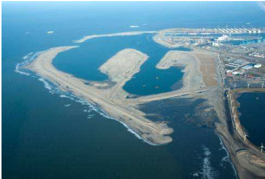
Figuur 2: Luchtfoto Maasvlakte 2 in aanleg (januari 2011)

Ter illustratie van de voortgang van de aanleg zijn hieronder opgenomen de (lucht)foto's van de Maasvlakte 2 in aanleg in januari 2011 (figuur 2) respectievelijk in juli 2011 (figuren 3 t/m 5).