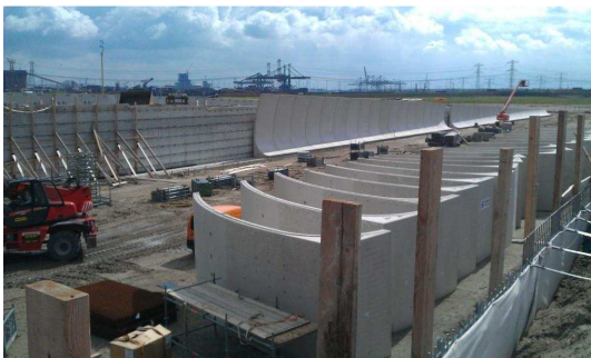
Figuur 4: Foto Knooppunt B in uitvoering (juli 2011)