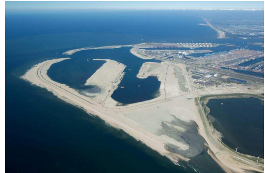
Figuur 3: Luchtfoto Maasvlakte 2 in aanleg (juli 2011)