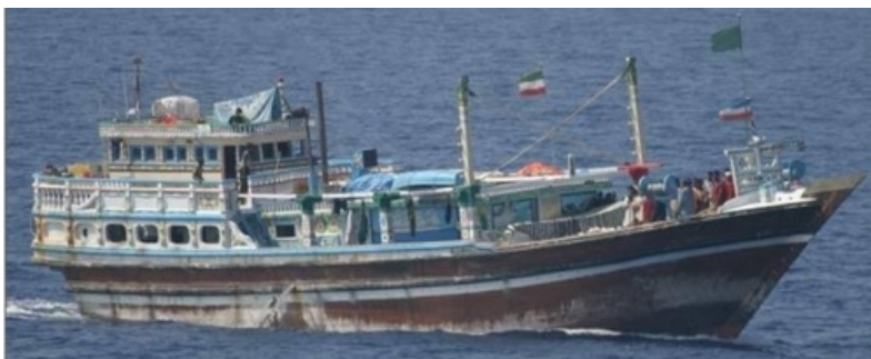
Afb. 3. Een 'Dhow', hier van het type 'Jelbut'.

Om het bereik op de Indische Oceaan verder te vergroten, maakten piraten steeds meer gebruik van gekaapte schepen (meestal dhows 7 maar ook andere schepen) die ze vervolgens als moederschip inzetten. Met deze moederschepen, met aan boord een of enkele skiffs , patrouilleren ze langdurig in het zeegebied.