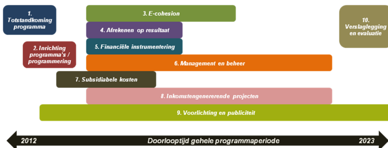
Afbeelding 1: tien hoofdonderwerpen in de Structuurfondsprogramma's

Bijlage B analyseert in detail voor alle hoofdonderwerpen die samenhangen met de uitvoering van de Structuurfondsprogramma's of de administratieve lasten en uitvoeringskosten die hieruit voortvloeien een direct gevolg zijn van de Structuurfondsverordeningen 2007-2013. Zonder in detail in te gaan op de afzonderlijke hoofdonderwerpen, komt uit deel 1 van bijlage B het algemene beeld naar voren dat het merendeel van de hoofdonderwerpen wel uitvoeringskosten die direct voortvloeien uit de Europese Structuurfondsverordeningen met zich meebrengen en dat de directe impact van de regels uit de Structuurfondsverordeningen op de administratieve lasten van begunstigden zeer gering is.