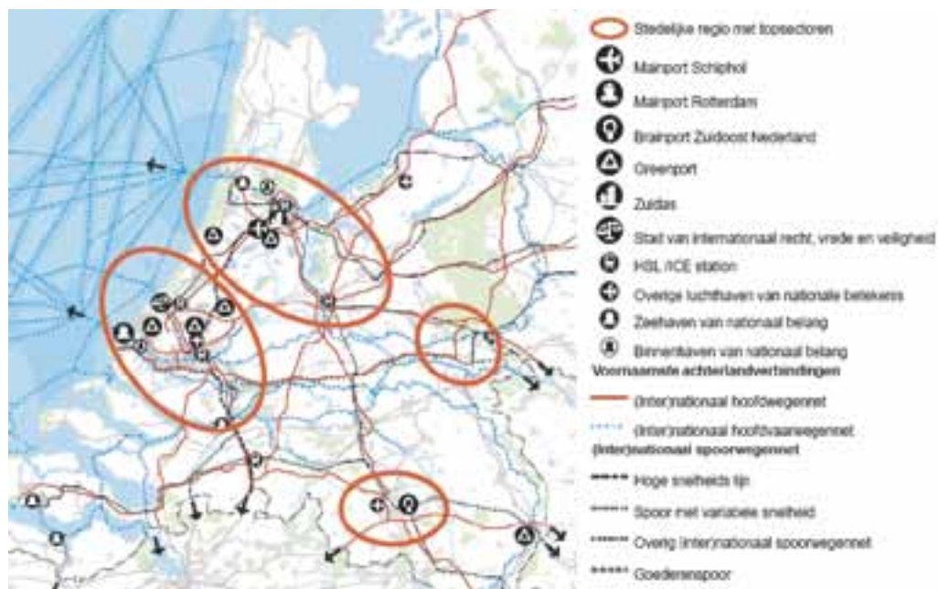
figuur 2.1 Stedelijke regio's met de diverse topsectoren uit de ontwerp Structuurvisie Infrastructuur en Ruimte

Om te zorgen dat de Noordvleugel, in het bijzonder de corridor Schiphol - Amsterdam - Almere goed bereikbaar blijft zijn aanpassingen aan de infrastructuur (auto, trein en metro) noodzakelijk. Momenteel zijn of worden diverse planstudies uitgevoerd om het rijkswegennet robuuster te maken. In het kader van OV-SAAL (Schiphol-Amsterdam-Almere-Lelystad) worden diverse uitbreidingen en verbeteringen op het spoor doorgevoerd. Naast bereikbaarheid dienen ook hoogwaardige (economische) functies versterkt en uitgebreid te worden. Hiermee wordt de internationale concurrentiekracht vergroot en de economische positie van Nederland in Europa en de rest van de wereld versterkt.