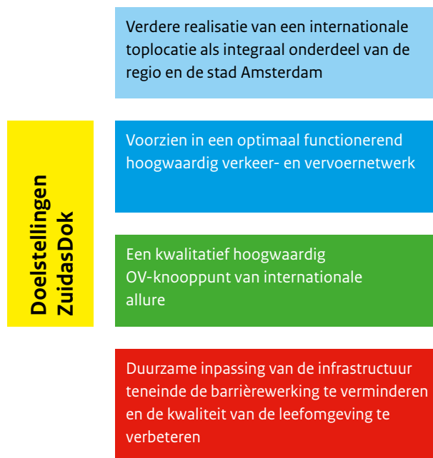
figuur 3.1 Centrale doelstellingen voor ZuidasDok

De ontwikkeling van ZuidasDok is belangrijk om de bereikbaarheid van de Noordvleugel van de Randstad en Zuidas op alle schaalniveaus te waarborgen en geeft bovendien een stevige impuls aan de doorgroei van Zuidas tot een internationale toplocatie met een gemengd stedelijk milieu. ZuidasDok voorziet in een samenhangend antwoord op de verschillende deelproblemen in het gebied. Voor ZuidasDok zijn vier doelstellingen geformuleerd, zoals weergegeven in figuur 3.1.