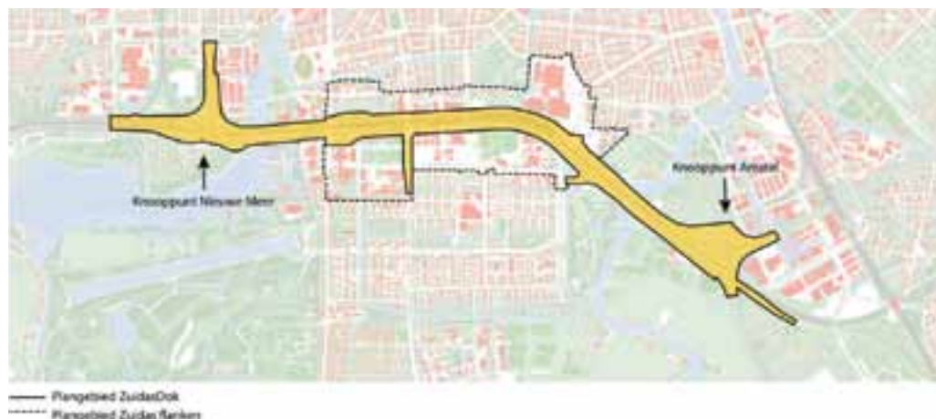
figuur 1.1 Plangebied ZuidasDok en ligging van Zuidas Flanken