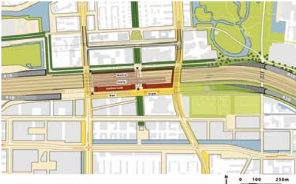
figuur 5.5 Ligging van de tunneluitgangen van de A10 zuid bij Zuidas en voorbeeld van stedelijke invulling van de zone boven de A10-tunnels

Door het ondergronds brengen van de A10-zuid bij het centrumgebied van Zuidas ontstaat een grote oppervlakte aan openbare ruimte, die kan worden ingericht en benut. Hierbij geldt wel dat vanwege veiligheidsredenen niet alle functies zonder meer op de A10-tunnels geplaatst kunnen worden. Door de vrijkomende ruimte kan het station uitgebreid worden, waardoor de toegankelijkheid en de zichtbaarheid vergroot worden. De trams, bussen en taxi's kunnen op korte afstand van de nieuwe OV-terminal gesitueerd worden en op de vrijkomende grond kunnen diverse stationsvoorzieningen en fietsenstallingen gerealiseerd worden.