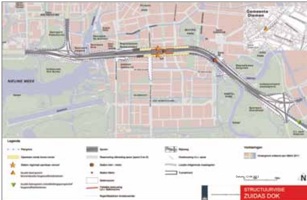
figuur 5.2 Structuurvisiekaart

Door de uitvoering van de beleidskeuzes, en dan met name door de uitbreiding van de A10 kunnen diverse bestaande functies aangetast worden. Dit betreft woningen, woonschepen, bedrijfsunits, parken, volkstuinen, sportterreinen, etc. Het uitgangspunt is dat met deze bestaande functies zoveel mogelijk rekening wordt gehouden. Het is echter niet uitgesloten dat enkele van deze bestaande functies moeten verdwijnen, verplaatst of verkleind worden om de uitbreiding van de A10 mogelijk te maken. Met de belanghebbenden van de bestaande functies die mogelijk aangetast worden of moeten verdwijnen zal in de vervolgfase (Tracébesluit en bijbehorende m.e.r.-procedure) zo vroeg mogelijk intensief overleg en afstemming plaatsvinden.