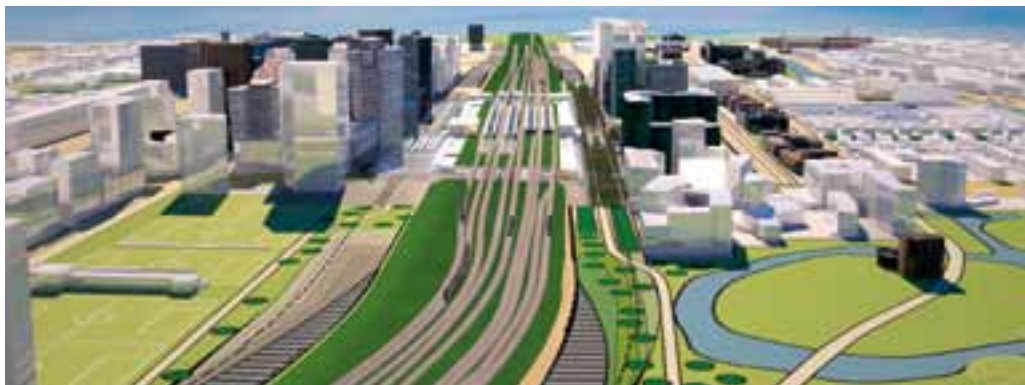
figuur 5.1 Impressie van de toekomstvisie

In figuur 5.1 is een impressie weergegeven van hoe het gebied er na realisatie van de beleidskeuzes uit kan komen te zien.