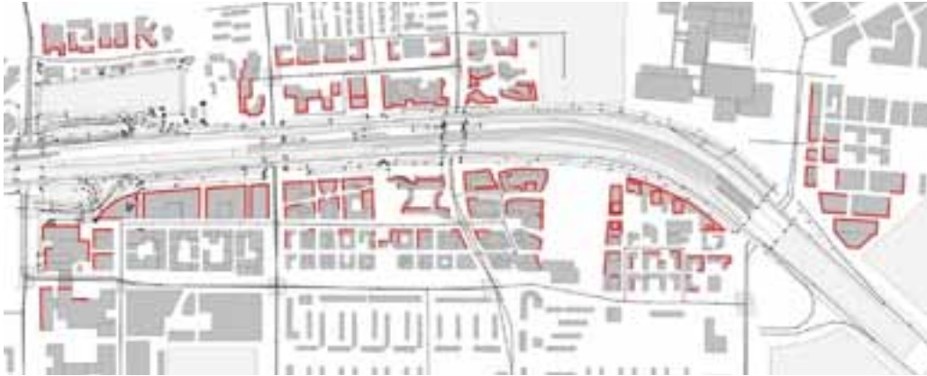
figuur 3.3 Boven de maximale ontheffingswaarde geluidbelaste gevels in de referentiesituatie als gevolg van de A10

Het realiseren van een hoogwaardige toplocatie met een gemengd stedelijk milieu in de directe nabijheid van hoofdinfrastructuur staat op gespannen voet met elkaar, ondanks dat hoofdinfrastructuur wel randvoorwaardelijk is voor een internationale toplocatie. Dit wordt versterkt door de groei van het autogebruik en in mindere mate van het spoorvervoer in dit gebied. Dit noodzaakt tot een robuuste inpassing van infrastructuur, zodat naast groei op deze infrastructuur ook de milieuhinder voor woningen, kantoren, voorzieningen en de openbare ruimte verminderd kan worden.