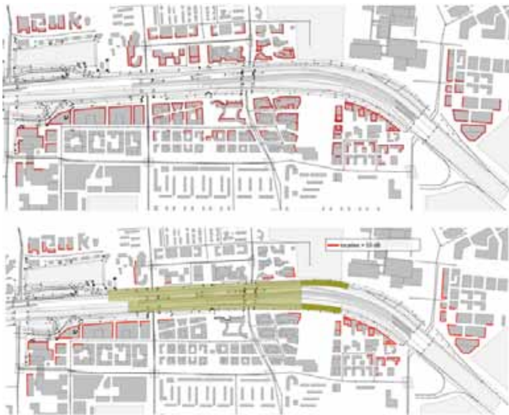
figuur 5.4 Gevels met een geluidbelasting boven de maximale ontheffingswaarde A10 zonder (boven) en met de realisatie van de beleidskeuzes (onder)

De A10-tunnel zal uit vier tunnelbuizen bestaan. Per rijrichting wordt een tunnelbuis met vier rijstroken voor het doorgaande verkeer gerealiseerd, inclusief vluchtcompartiment en een tunnelbuis met een rijstrook en een weefvak voor het bestemmingsverkeer. De noordelijke tunnelbuizen, bestemd voor het verkeer vanaf knooppunt Amstel richting knooppunt De Nieuwe Meer, hebben een lengte van circa 1.100 meter. De zuidelijke tunnelbuizen, bestemd voor het verkeer vanaf knooppunt De Nieuwe Meer richting knooppunt Amstel, hebben een lengte van circa 1010 meter. Dit verschil in lengte is het gevolg van een verschillende ligging van de tunnelmonden aan de westzijde van de tunnel. De zuidelijke tunnelbuizen zijn hier circa 90 meter korter om het invoegen op de rijbanen voor het bestemmingsverkeer voor het begin van de tunnel te laten plaatsvinden.