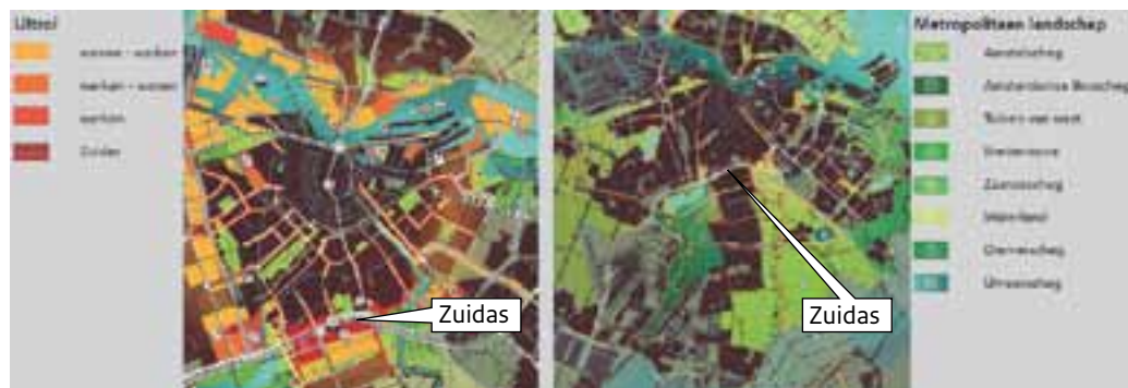
figuur 2.2 De uitrol van het centrumgebied (links) en de grote landschappelijke structuren (rechts)

Twee grote groene landschapstructuren omzomen Zuidas: de Amstelscheg (ten oosten van Zuidas) en het Amsterdamse Bos (ten westen van Zuidas). Door de combinatie van een hoogwaardig centrum-stedelijk milieu en de groene-blauwe landschappen ontstaat een uniek gebied waar diverse functies hand in hand gaan.