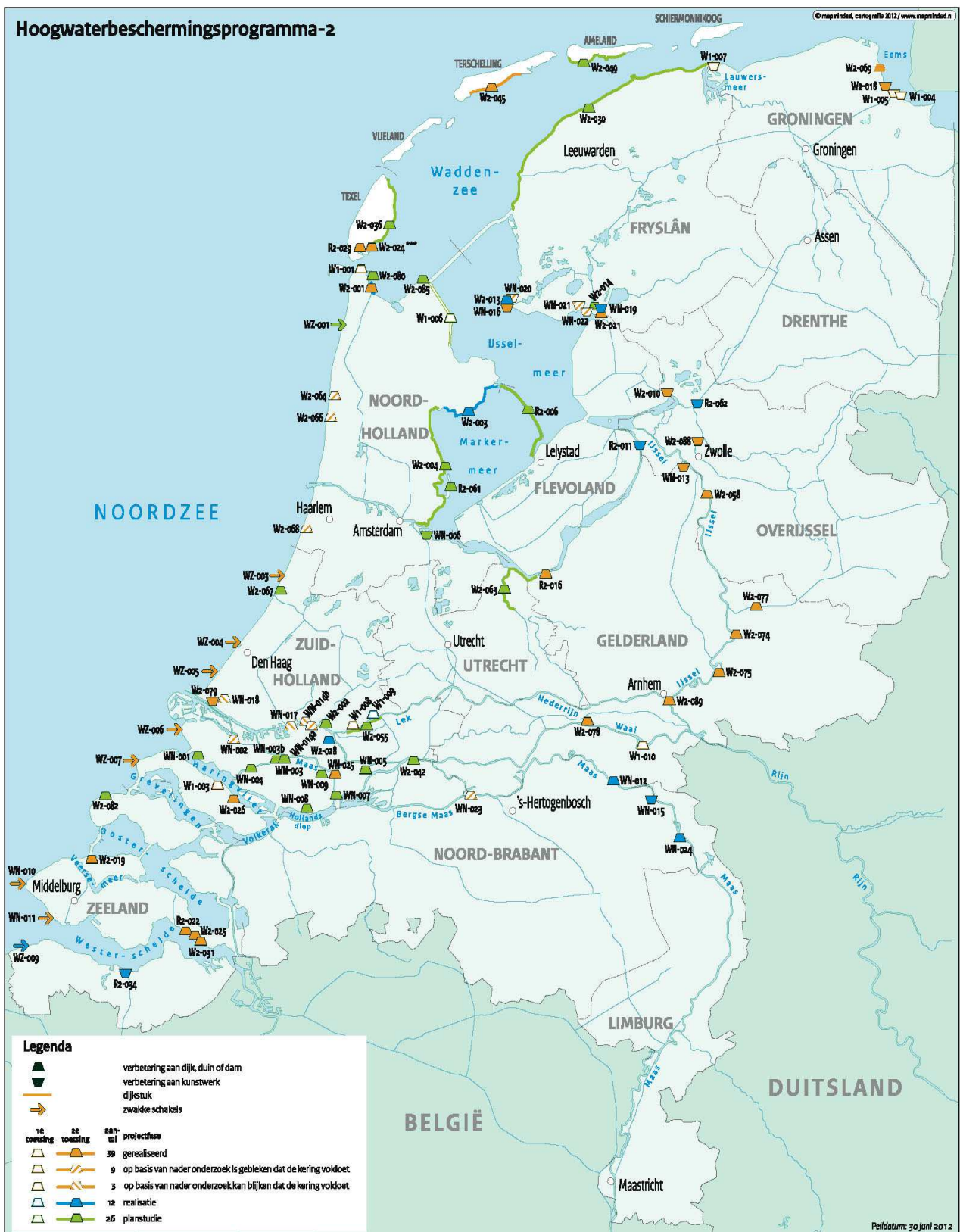
Actuele scope van het programma, peildatum 30 juni 2012.