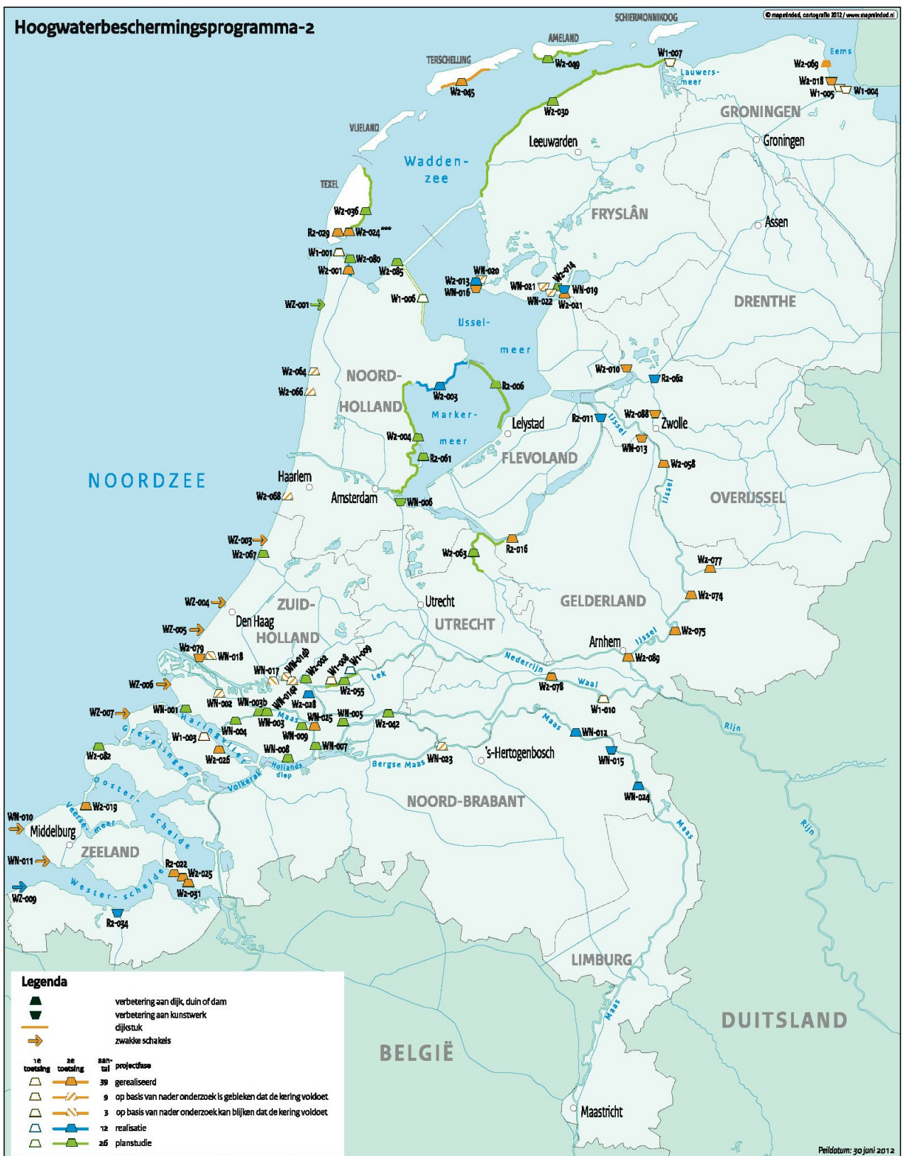
Actuele scope van het programma, peildatum 30 juni 2012.