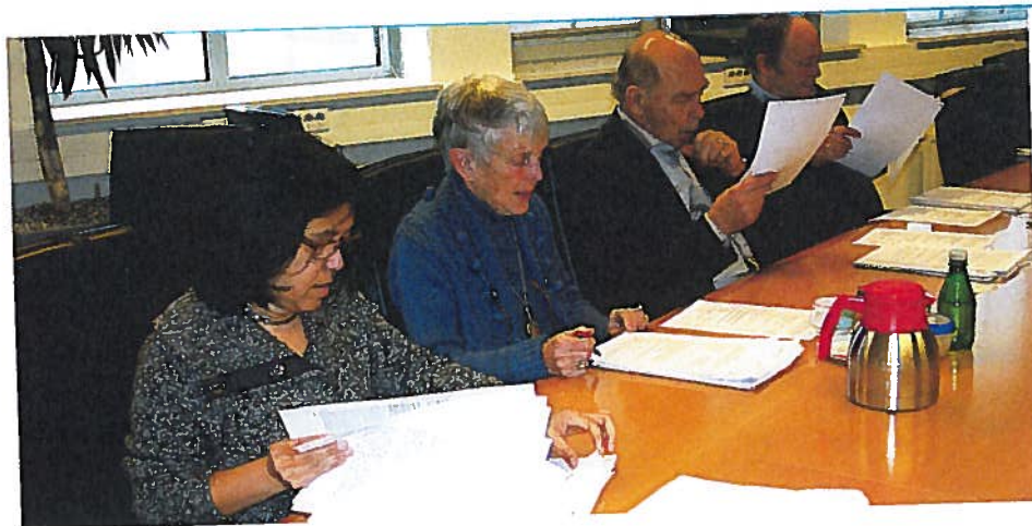
Vergadering Pensioen- en Uitkeringsraad.

De Raad kwam in 2011 in wisselende samenstelling 60 keer bijeen. Naast plenaire vergaderingen zijn bestuurlijke zaken afzonderlijk besproken in de Sectie Bestuur. In de casuïstiekvergaderingen zijn besluiten genomen over aanvragen en adviezen gegeven op verzoek van de SVB.