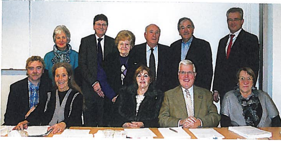
Cliëntenraad Verzetsdeelnemers en Oorlogsgetroffenen.

Voor het optimaal functioneren van de Raad is een goede samenwerking noodzakelijk. De Raad bespreekt ontwikkelingen en signalen daarom geregeld met de leidinggevenden van de afdeling Verzetsdeelnemers en Oorlogsgetroffenen, met de Raad van Bestuur van de SVB en met de leden van de Cliëntenraad.