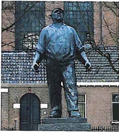
Monument "De Dokwerker" voor de Februaristaking 1941 van beeldhouwer Mari Andriessen.

Vanuit de verantwoording voor het beleid is het voor de Raad van groot belang om voeling te houden met wat er leeft onder de verschillende doelgroepen van de wetten voor verzetsdeelnemers en oorlogsgetroffenen binnen Nederland en in het buitenland.