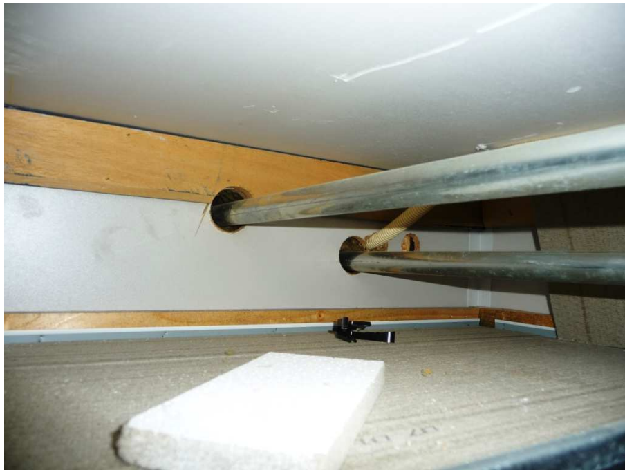
Niet afgewerkte doorvoeringen door een brandwerende scheiding.