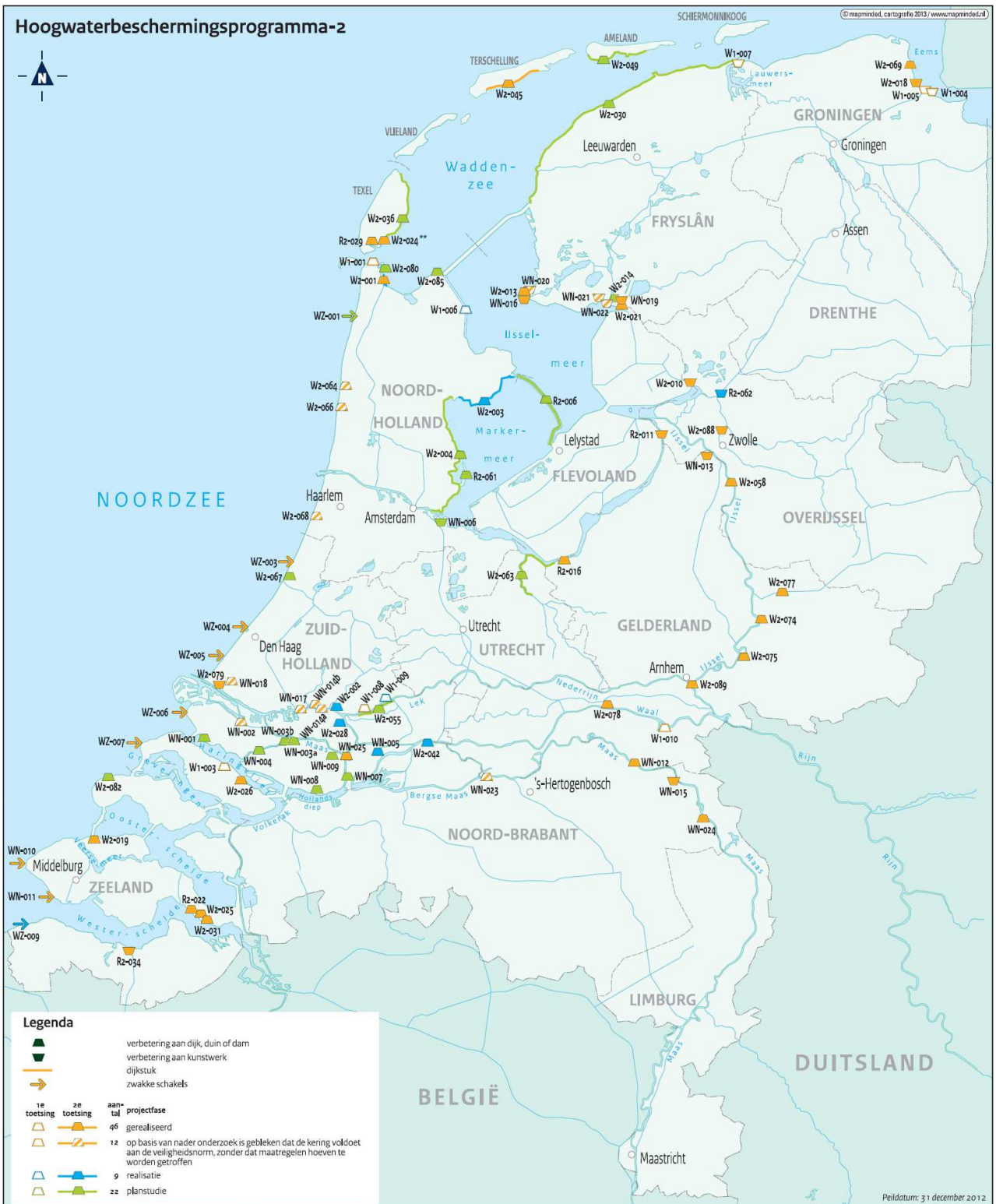
Actuele scope van het programma, peildatum 31 december 2012.