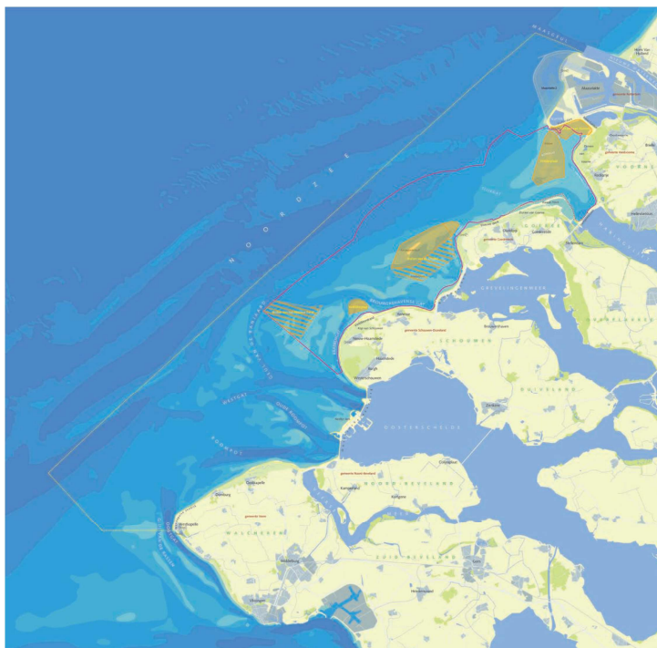
Figuur 2: Voordelta en het daarin gelegen bodembeschermingsgebied (binnen de rode contour) met rustgebieden (geel: jaarrond en geel gearceerd: alleen gedurende de winter)