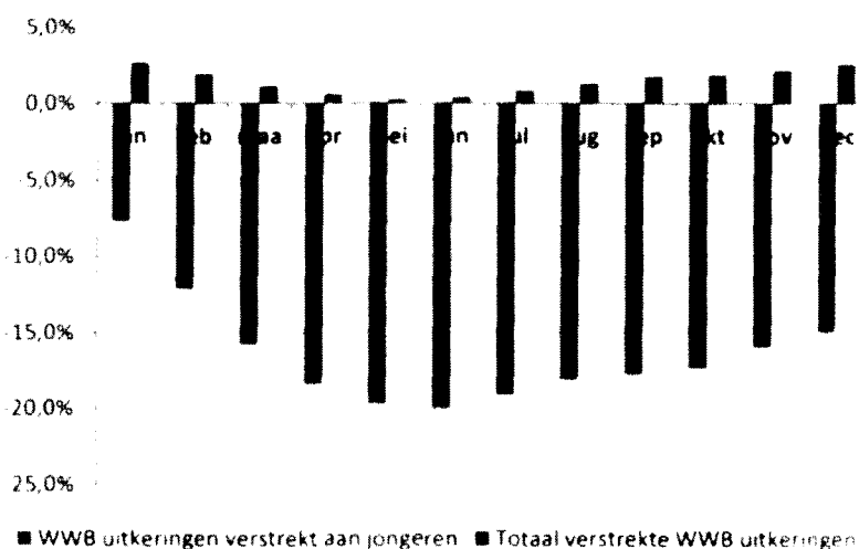
Figuur 3.1 Mutatie aantal bijstandsuitkeringen in 2012 t.o.v. van dezelfde maand in 2011

Cijfers van het CBS geven een indicatie dat de aangescherpte uitkeringsvoorwaarden voor jongeren er toe leiden dat minder jongeren een beroep doen op de WWB. De ontwikkeling van het aantal bijstandsuitkeringen verstrekt aan jongeren laat sinds de introductie van deze maatregelen een forse daling zien (zie figuur 3.1). Deze ontwikkeling is tegengesteld aan de landelijke trend dat het totaal aantal verstrekte WWB uitkeringen juist toeneemt.