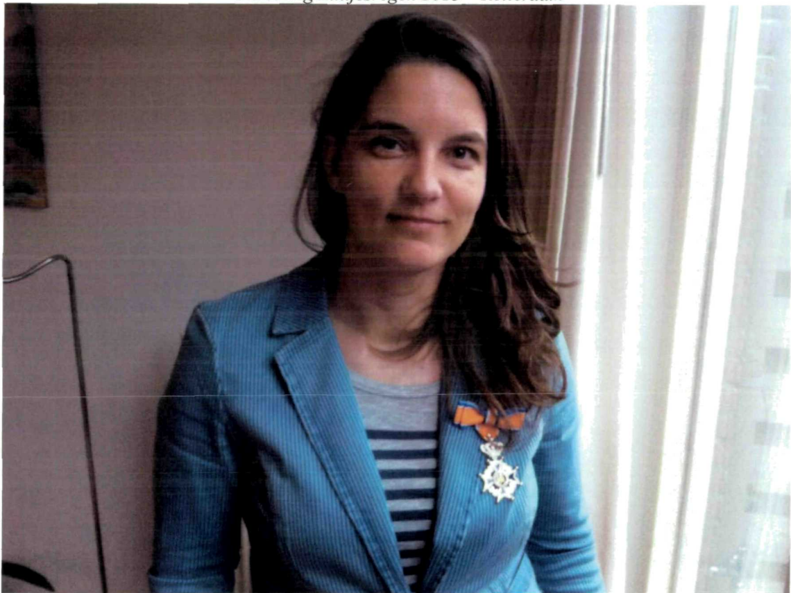
Uitreiking Lintjesregen 2013 – Breda