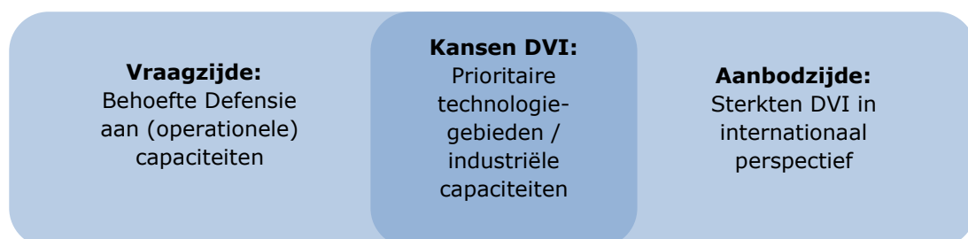
Figuur 3: Match van vraag- en aanbodzijde, leidend tot prioritaire technologiegebieden / industriële capaciteiten 10 .

Deze deelverzameling is kansrijk om de hierop actieve DVI te positioneren, in overeenstemming met de doelstelling van de DIS.