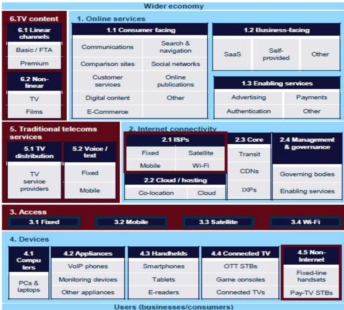
Het internetwaardeweb.

De verschillende partijen in dit plaatje hebben ieder een eigen achtergrond, ze komen uit andere domeinen die nu onderling afhankelijk worden, het zijn markten op zichzelf. Er zijn veel bewegingen zichtbaar tussen deze voorheen gescheiden werelden (convergentie). Spelers proberen op steeds meer verschillende borden te schaken. Zo zien we dat telecomspelers als KPN en UPC vanuit hun sterkten (2.3 ISPs & 3 netwerken) ook actief zijn geworden op online diensten (IPTV) apparatuur (Horizon box) en de content-markt (joint-venture Ziggo met HBO). Een tegengestelde beweging zien we bij internetspelers die vanuit de online diensten (Google) of apparatuur (Samsung) verticaal integreren naar andere domeinen. Belangrijk is dit speelveld niet te zien als lineaire productieketen, maar als een web; voor de levering van een elektronisch product of dienst is men niet langer afhankelijk van één route. Een voorbeeld: Een webwinkel kan zelf zijn website hosten, óf dat uitbesteden aan een hosting provider óf een cloud-aanbieder. Voor het verwerken van betalingen heeft hij ook verschillende opties zoals factureren, IDEAL, PayPal of creditcardbetaling. Tot slot kan hij ervoor kiezen om alleen te opereren via een website, of ook via een app, waarbij hij dan weer kan kiezen op welk platform (bijv. Android, iOS, Windows) hij aanwezig wil zijn.