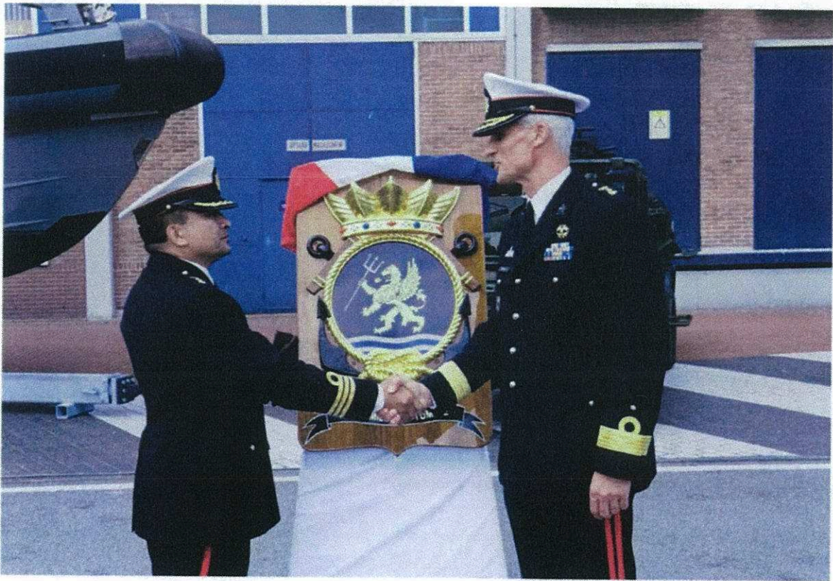
Het nieuwe embleem voor de Netherlands Maritime Special Operations Forces van het Korps Mariniers.