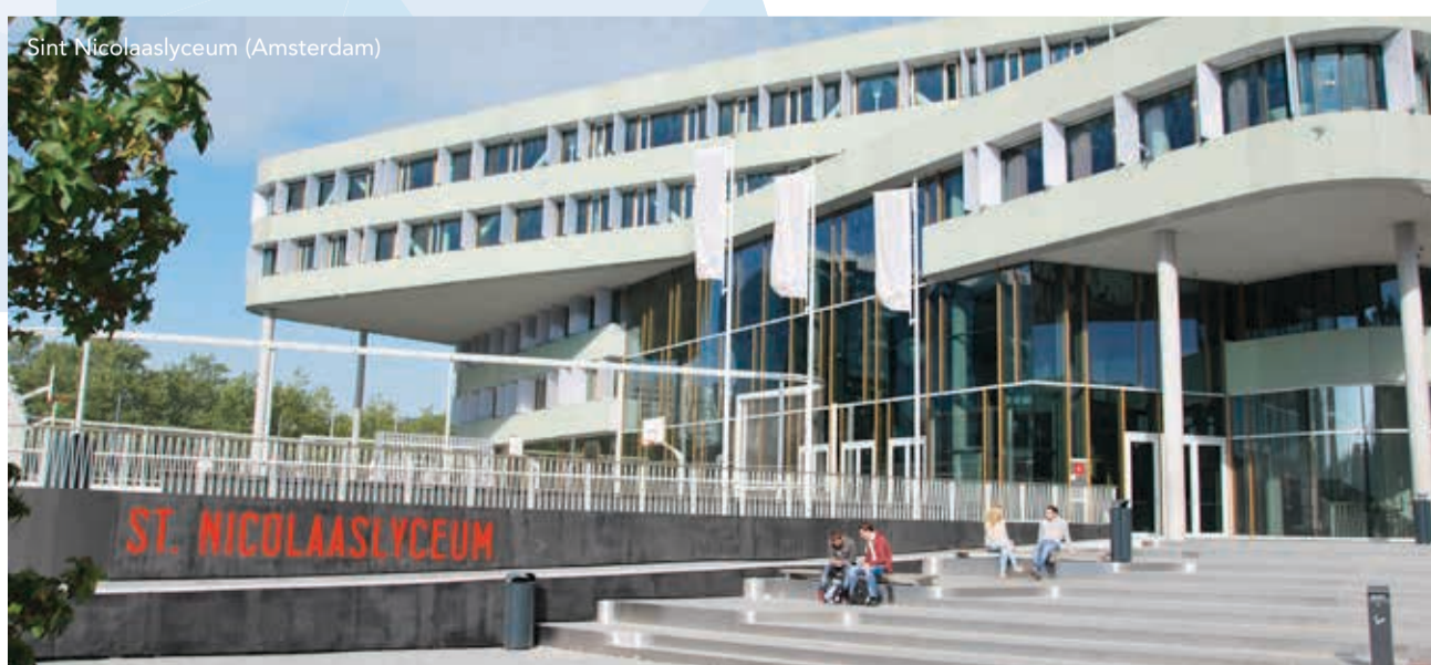
Sint Nicolaaslyceum (Amsterdam)