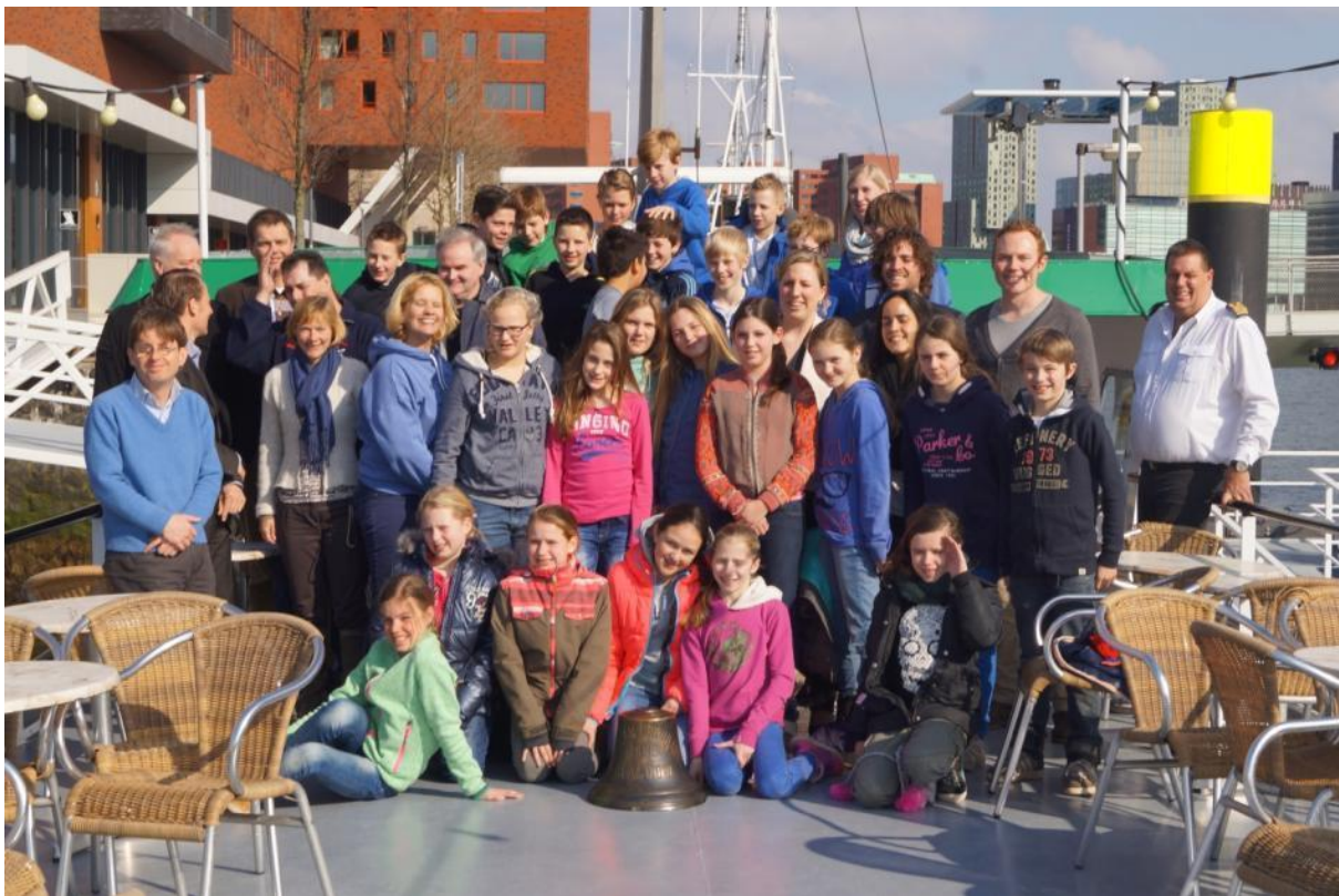
Boottocht door de haven van Rotterdam, 4 maart 2014