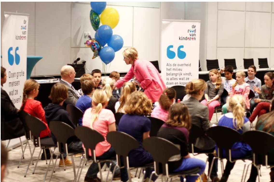
Kinderen in dialoog met stakeholders van de Noordzee tijdens Noordzee congres, 13 maart 2014