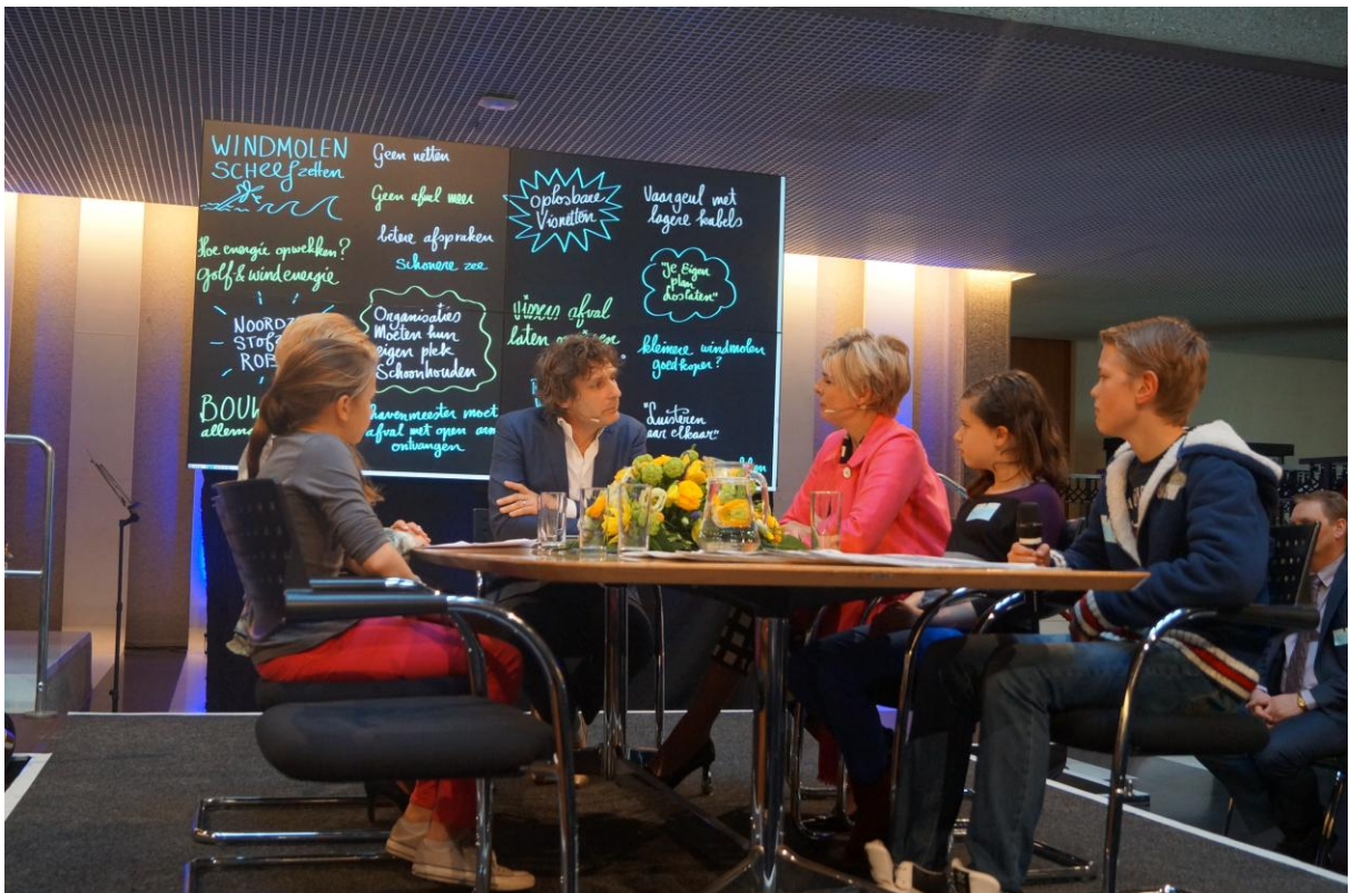
'De Zee Stroomt Verder', napraten over de dialoogsessie tijdens ronde tafelgesprek Noordzeecongres, 13 maart 2014