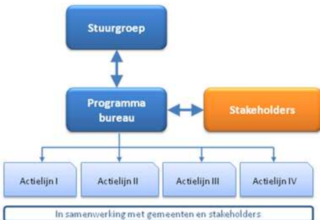
Figuur 3: Schematische weergave organisatie Uitvoeringsprogramma VANG – Huishoudelijk Afval

Het Programmabureau zorgt dat bij het opstellen van het werkplan nadrukkelijk een klankbord wordt gezocht met deze belangrijke partijen voor het realiseren van de gestelde doelen. Verder zullen deze partijen bij de individuele acties betrokken worden en deelnemen, vanuit hun eigen taken en verantwoordelijkheden.