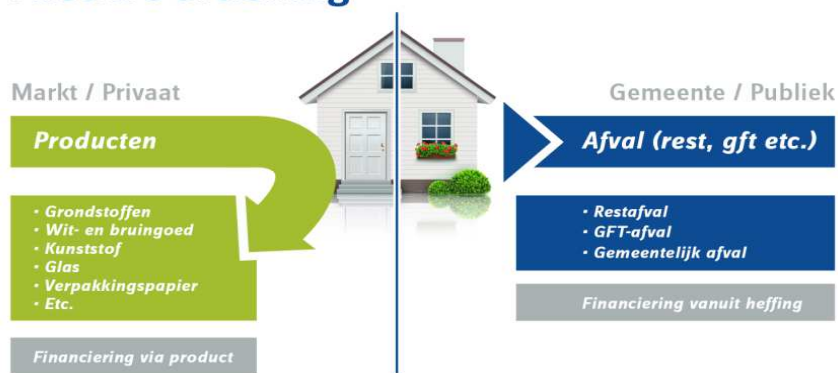
Figuur 1. Weergave van vervuiler betaalt principe toegespitst op huishoudelijk afval