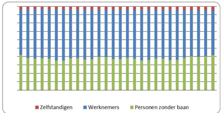
Figuur 2: Ontwikkeling in aandeel werknemers, zelfstandigen en personen zonder baan; EU 26 (CBS).