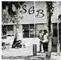
Scholengemeenschap Bonaire