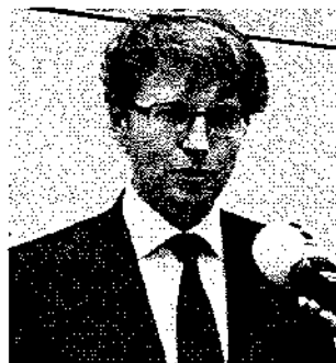
Staatssecretaris Sander Dekker

DEN HAAG - Het onderwijs op de middelbare scholen in Caribisch Nederland moet snel beter. Het afgesproken basisoniveau moet gehaald worden, de schoolbesturen moeten hun taken beter uitvoeren en het tekort aan leraren moet opgelost.