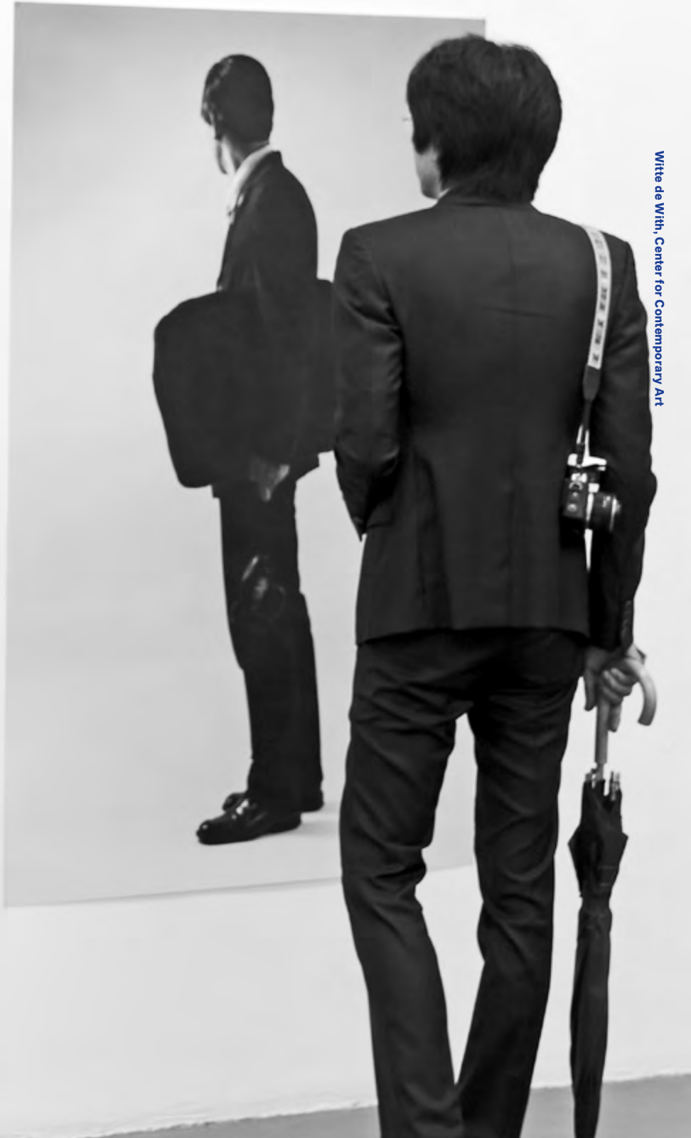
Witte de With, Center for Contemporary Art