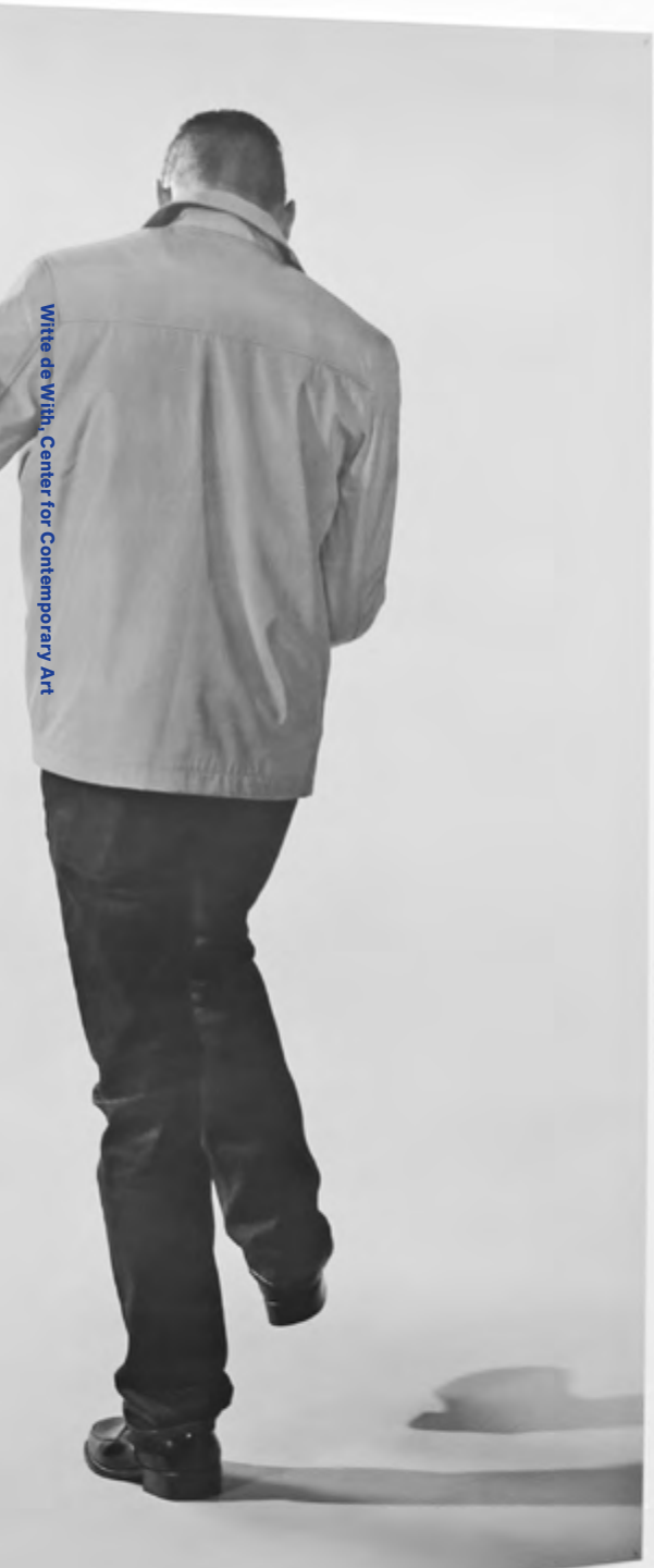
Witte de With, Center for Contemporary Art