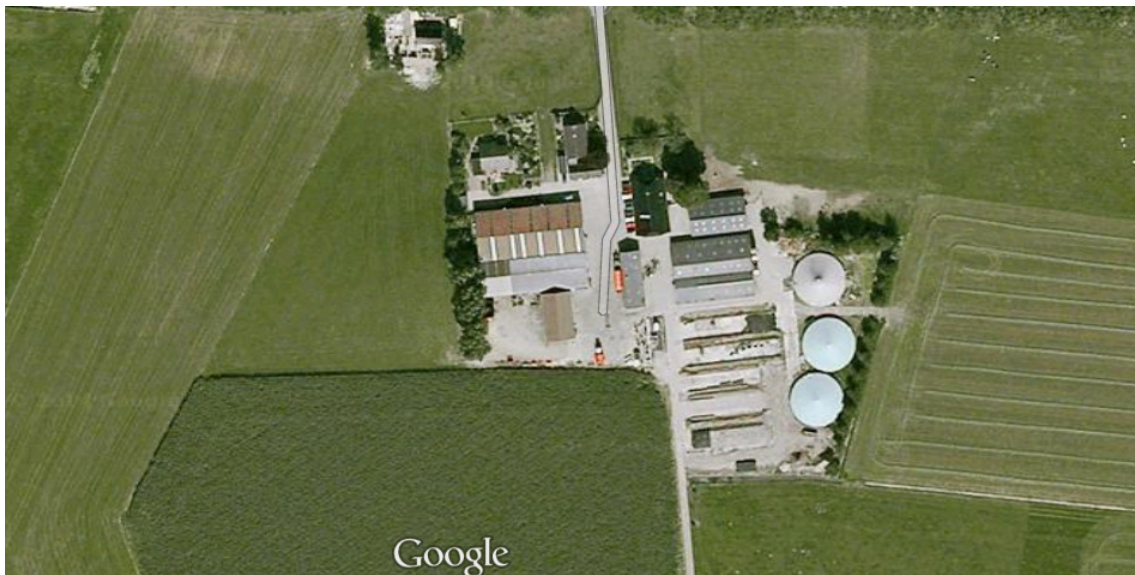
Covergistinginstallatie in het landelijke gebied

'Hooft een covergistinginstallatie thuis op een industrieterrein of bij een agrarisch bedrijf?' Uit een inventarisatie van Rijkswaterstaat Leefomgeving blijkt dat er discussie is over deze vraag (Rijkswaterstaat Leefomgeving, 2015). In de praktijk wordt er verschillend mee omgegaan. In de omgevings-verordening van de provincie Groningen is vastgelegd dat covergistinginstallaties op een industrie-terrein moeten worden gevestigd, tenzij sprake is van een bedrijfseigen activiteit. In Limburg is de werkafpraak dat covergistinginstallaties bij het agrarisch bedrijf de voorkeur hebben. In Noord-Brabant verschillen de meningen. Voordelen die worden genoemd van een covergistinginstallatie op een industrieterrein zijn het kleinere aantal omwonenden, vaak betere toegangswegen en het visuele aspect. Nadelen zijn meer vervoersbewegingen, omdat alle mest nu ook aangeleverd moet worden, en de mestgeur, die bewoners en bedrijven op en rondom industrieterreinen niet gewend zijn.