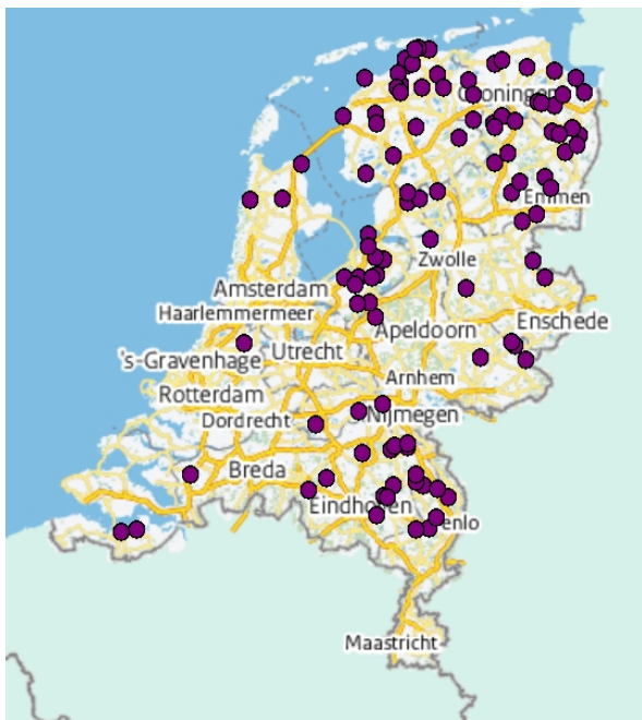
Figuur 2. Ligging van de covergistingsinstallaties van mest en covergistingsmaterialen in Nederland: Covergistingsinstallaties ( http://www.b-i-o.nl/ , website geraadpleegd op 16-7-2014).

In 2013 waren er 102 covergistingsinstallaties van mest en covergistingsmaterialen (RVO, 2014). De meeste staan in het noorden van ons land (Figuur 2). Ook waren er drie monovergisters voor de vergisting van enkel dierlijke mest (RVO, 2014). Daarenboven zijn er 82 communale vergistingsinstallaties bij riool- en afvalwaterzuiveringsinstallaties, 13 vergistingsinstallaties in de voedings- en genotsmiddelenindustrie en 11 vergistingsinstallaties voor groente- en tuinafval (GFT) en de organische natte fractie in niet-gesorteerd grijs afval ( www.b-i-o.nl ). Onderhavig rapport gaat enkel over de covergistingsinstallaties van mest en covergistingsmaterialen.