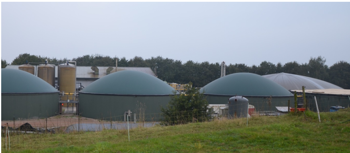
Covergisting draagt bij aan de productie van duurzame energie

Covergisting heeft echter, net als andere productiewijzen van duurzame energie, een prijs. Er is subsidie nodig, want zonder subsidie is covergisting financieel niet rendabel voor de exploitant van de vergistingsinstallatie, bij de huidige lage prijzen voor elektriciteit, warmte uit fossiele energiebronnen en groen gas. Afhankelijk van de prijs van covergistingmaterialen, die gemiddeld genomen veel meer energie leveren dan dierlijke mest, dekken de inkomsten uit de levering van biogas niet meer dan circa de helft van de exploitatiekosten. De andere helft moet uit subsidies komen. Verschillende exploitanten van vergistingsinstallaties zijn failliet gegaan doordat de inkomsten uit biogas zijn gedaald en de prijzen van covergistingmaterialen de laatste jaren hoger zijn dan aangenomen in de plannen van de covergistingsinstallatie.