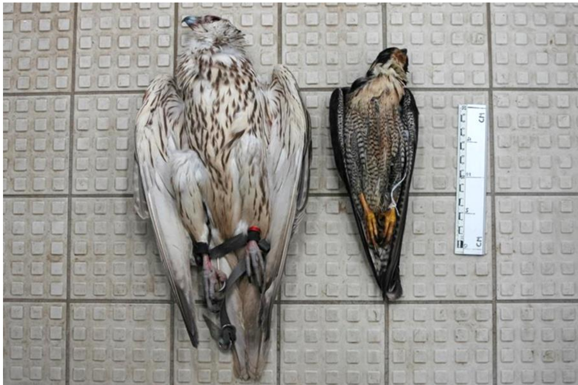
Fig. 1. Grote hybride valk (wijfje, waarschijnlijk gier- x sakervalk) naast een Nederlandse slechtvalk (man). De hybride valk is in Nederland dood gevonden (ontsnapt exemplaar wat zich aan de leertjes had opgehangen in een boom). Dergelijke grote hybriden worden geregeld in Nederland aangetroffen en weten zich langdurig te handhaven. Tevens resulteert het in verstoring van slechtvalkbroedparen en vernieling van legsels in nestkasten (zie H4).