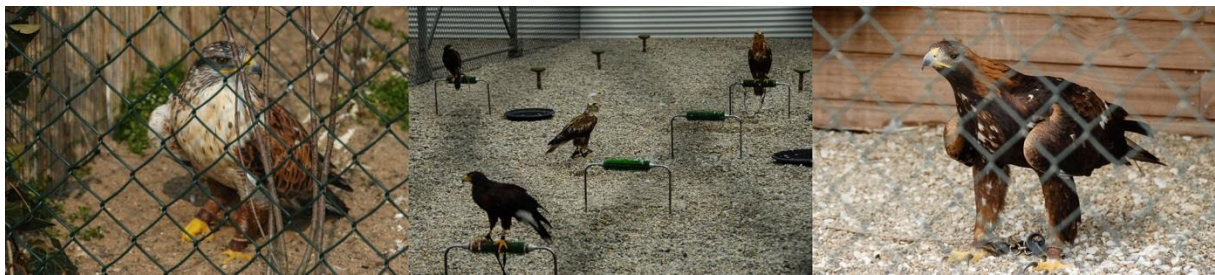
Fig. 2. Gehouden roofvogels voor de fok in Nederland. Vlnr: koningsbuizerd, twee arendbuizerds en twee woestijnbuizerds (linker twee vogels), steenarend.