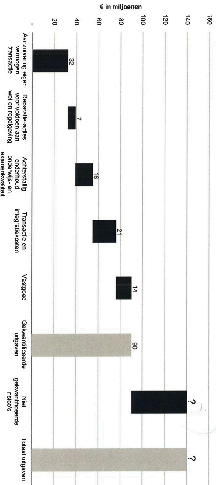
Samenvatting uitgaven voorgestelde transactie