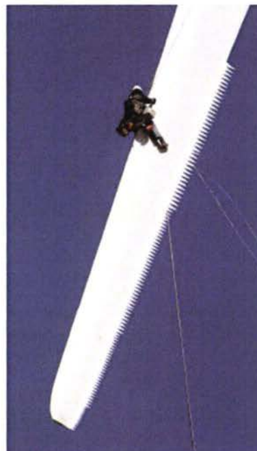
Figuur 2.2: Toepassing van zaagtanden op de wieken van een windturbine ten behoeve van geluidsreductie. 17

Gemeten vlak boven de grond voor de turbine, wieken draaien met de klok mee. De neergaande slag wordt op de grond als het luidste ervaren (rode kleur) omdat de wieken naar voren (in draairichting) het meeste geluid produceren.