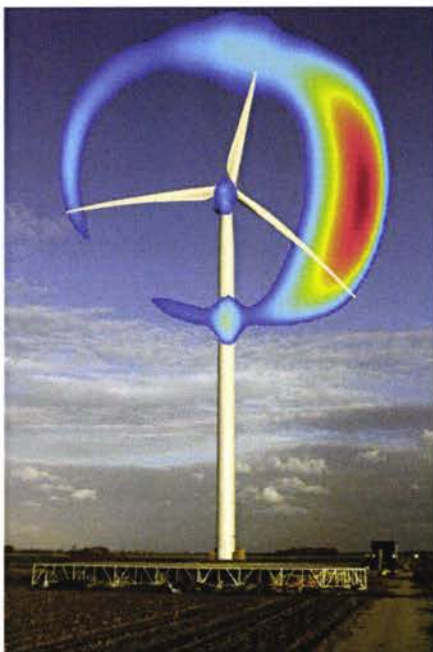
Figuur 2.1: Visualisatie van geluidsbronnen op een windturbine voor een specifieke frequentie. 16

Waar de bovenstaande mogelijkheden zich richten op het verlagen van de emissie, zijn er ook mogelijkheden om de immissie, het geluidsniveau ter plekke van de waarnemer, te beperken. Geluidsisolatie van huizen kan worden toegepast om het geluid binnenshuis te beperken. Daarnaast kan rekening worden gehouden met windrichtingsafhankelijke, atmosferische en andere geluidsvoortplantingseffecten bij de planning van een windpark en selectie van de windturbines hiervoor.