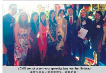
VCHO wenst u een voorspoedig Jaar van het Schaaap! 中 華 會 祝 大 家 羊 年 快 樂 ， 吉 祥 如 意 ！