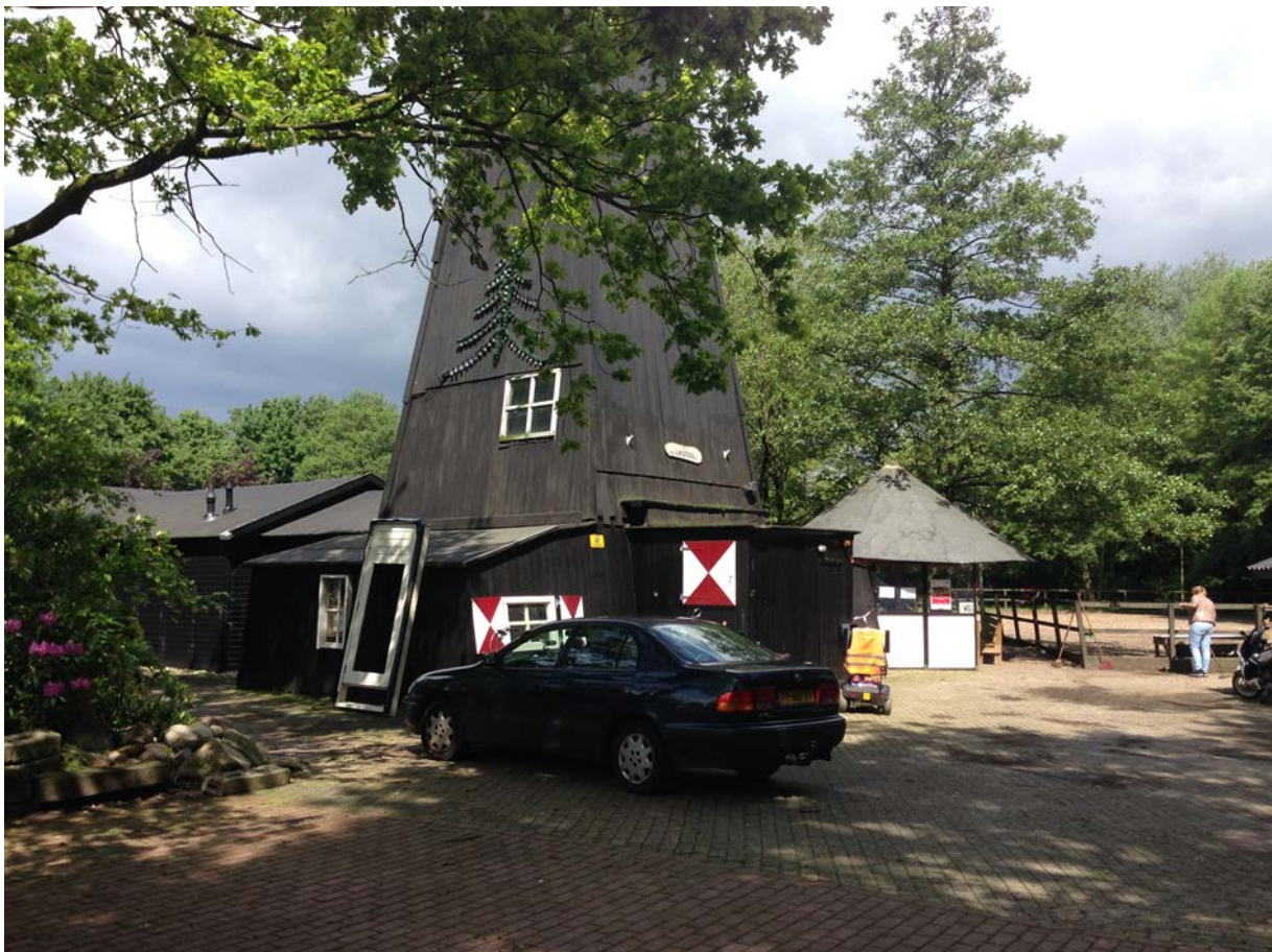
Figuur 1.5 't Geerdink

De directe aanleiding om een bewonersbedrijf op te richten zijn de bezuinigingen van gemeente, en in het bijzonder de bezuiniging op begeleidingskosten van werkervaringsplaatsen, waardoor eind 2012 de op dat moment grootste inkomstenbron voor de stichting wegvalt. Daardoor konden twee personeelsleden niet langer worden aangehouden. Door de verminderde beschikbaarheid van mensen voor werkervaringstrajecten kan de stichting ook minder opdrachten uitvoeren voor de gemeente en de woningcorporatie. De stichting verkeert daardoor inmiddels in financiële problemen.