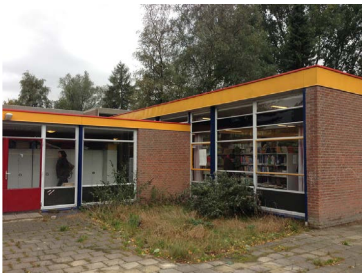
Figuur 1.4 De school in Oktober 2013