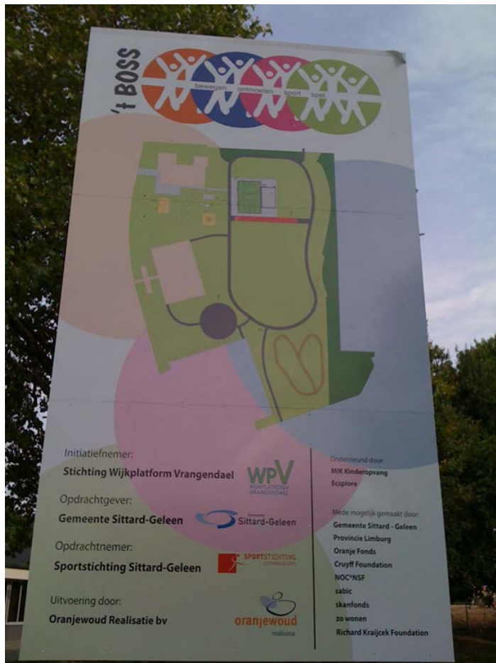
Figuur 5.1 Het plan voor het BOSS park.

conferentie in Den Haag in juni 2011 (zie paragraaf 2.1) en/of bij de door het LSA georganiseerde studiereis naar het Verenigd Koninkrijk.