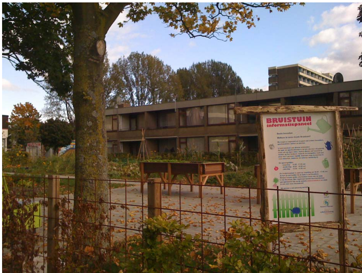
Figuur 1.3 De Bruistuin.

Alle huurders tekenen een contract waarin staat dat zij voor twee uur vrijwilligerswerk doen. Zo zullen de studenten begeleiding gaan bieden bij een nieuw project van het bewonersbedrijf, de Kinderwijkraad (geïnitieerd door oud LSA-medewerker). Bewoners kunnen voor een nog lagere huur tekenen als zij zich meer dan twee uur willen inzetten voor het Bruishuis. Zo zijn er een aantal huurders die zich fulltime inzetten voor het beheer en in ruil daarvoor geen huur betalen. Het blijkt in deze fase nog wel lastig om het aan de huurkorting gekoppelde vrijwilligerswerk te organiseren. Het moet immers allemaal beheerd worden.