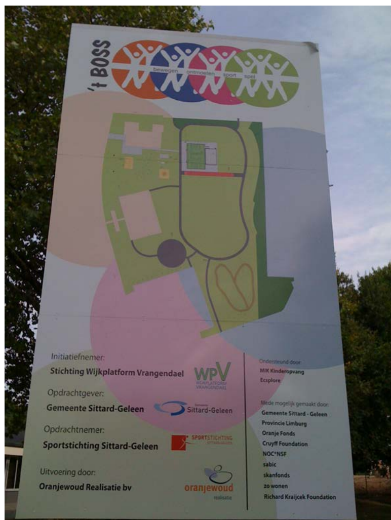
Figuur 1.8 Het plan voor het BOSS park.

Na de projectperiode (2010-2013) dient de organisatie ingebed te worden in een bewonersorganisatie die het beheer, het onderhoud en de exploitatie van het park gaat uitvoeren. Daartoe is de stichting het BOSS park in december 2013 opgericht. De projectperiode is echter nog met vier jaar verlengd en in 2014 is de statusquo gehandhaafd, wat betekent dat de sportstichting nog het beheer en onderhoud uitvoert. Doorontwikkeling naar een bewonersbedrijf heeft aan het einde van de onderzoeksperiode nog niet plaatsgevonden.