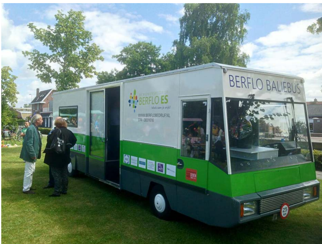
Figuur 7.2 De Berflo Baliebus

Berflo Baliebus is een SRV-wagen die is omgebouwd tot een mobiele ontmoetingsruimte en die op vaste dagen en tijdstippen door de wijk rijdt. In de Baliebus kunnen buurtbewoners terecht voor hulp, ondersteuning en informatie, maar ze kunnen zich ook melden als vrijwilliger voor enkele andere projecten (zie hieronder) van het bewonersbedrijf. Indien nodig worden bewoners met hun vraag of probleem doorverwezen naar deskundigen of instantie(s).