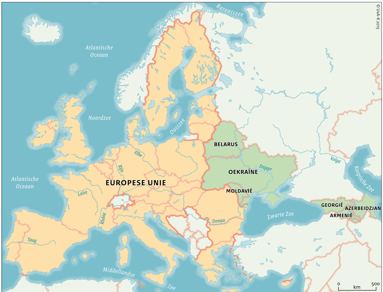
De Europese Unie en de landen van het Oostelijk Partnerschap.