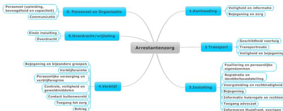
Figuur 2: Overzicht proces arrestantenzorg en deelaspecten

Aan de hand van interviews, dossier- en documentenstudies en observaties zijn de Inspecties nagegaan hoe de politie uitvoering geeft aan arrestantenzorg. Per eenheid hebben de Inspecties gesproken met de volgende respondenten: