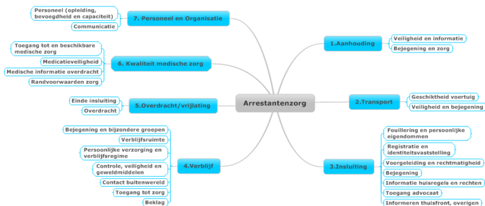
Figuur 2. Onderzoekaspecten

Aan de hand van interviews, dossier- en documentenstudies en observaties gaan de inspecties na hoe de politie uitvoering geeft aan arrestantenzorg. Per eenheid spreken de inspecties met de volgende respondenten: