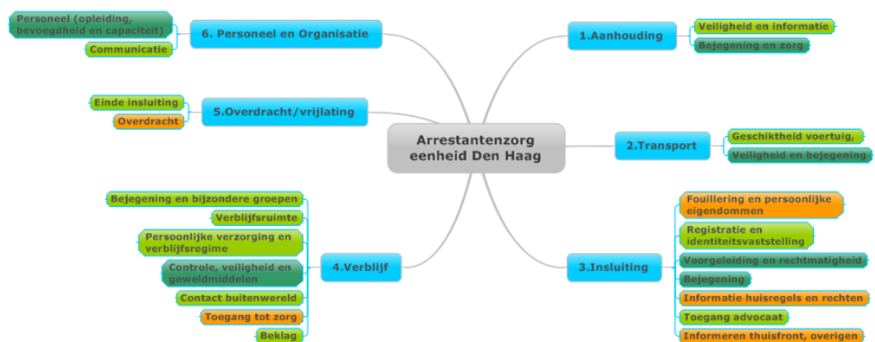
Figuur 5: Eindoordeel proces arrestantenzorg en deelaspecten

In de voorgaande hoofdstukken zijn verschillende aspecten van de arrestantenzorg aan de orde gekomen. Over een aantal onderwerpen hierbinnen zijn de inspecties erg positief en een aantal onderwerpen verdienen nog aandacht. Onderstaande figuur geeft een totaaloverzicht van de wijze waarop het proces arrestantenzorg functioneert op alle getoetste aspecten en daarbij behorende onderwerpen. In deze figuur is met kleurcodes aangegeven in welke mate de arrestantenzorg voldoet aan de gestelde normen en verwachtingen op de verschillende onderwerpen binnen de toetsingskaders van IVenJ en IGZ: donkergroen wil zeggen dat de arrestantenzorg volledig voldoet, lichtgroen wil zeggen voldoet overwegend maar niet volledig, oranje houdt in dat de arrestantenzorg in beperkte mate voldoet aan de criteria en een rode kleur wil zeggen dat de arrestantenzorg niet voldoet.