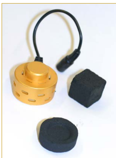
Figuur 3: Enkele verhittingsbronnen: elektrisch kooltje, quick-light-kooltje en natuurkooltje (kokos)

CO ontstaat door onvolledige verbranding van de kooltjes. Deze onvolledige verbranding kan niet voorkomen worden door de kooltjes op een andere manier te gebruiken. CO komt vrij bij de verhitting van alle niet-elektrische kooltjes. Het deel van de kooltjes dat niet verbrandt komt vrij als rook (8). Bij het roken van een waterpijp komt meer CO vrij dan bij het roken van sigaretten. Dit kan wel tot 30 keer meer zijn.