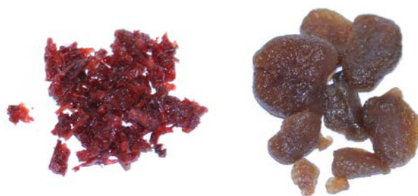
Figuur 2: Waterpijptabak en gedroogde vruchten (aardbei)

Er kunnen verschillende soorten kruiden worden gerookt. Voorbeelden zijn theebladeren in combinatie met suikerrietvezels, en kruiden met een rustgevendende werking zoals lavendel, bijvoet en eucalyptus. De exacte samenstelling van gebruikte kruidenmengsels is vaak onbekend. Voorbeelden van gedroogde vruchtenmengsels zijn vruchtenstukjes en vruchtengelei gemengd met melasse in populaire smaken als appel, mint, watermeloen en aardbei. Als alternatief voor tabak, kruiden of gedroogde vruchten worden ook wel aromatische stoom- of dampstenen gebruikt. Deze steentjes zijn doordrenkt met een aroma. Het aroma verdampt tijdens het roken en wordt vervolgens geïnhaleerd (5).