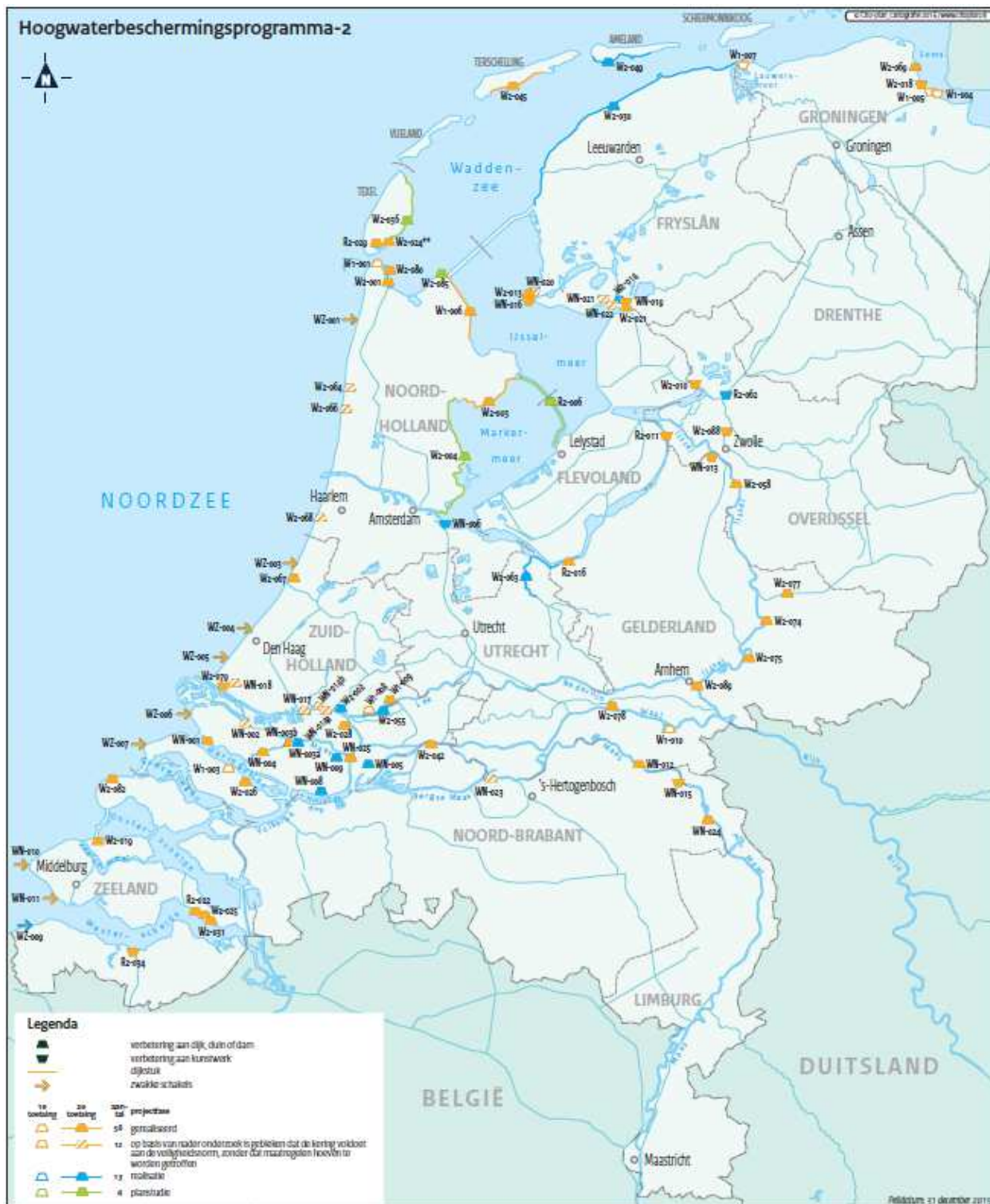
Figuur 2 Actuele scope van het programma, peildatum 31 december 2015