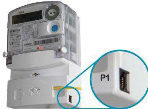
Afbeelding 2: voorbeeld consumentenpoort (P1-aansluiting) voor directe uitleesmogelijkheden

Consumenten die zelf de ontwikkeling van het eigen elektriciteitsverbruik in real time willen volgen, kunnen gebruik maken van de consumentenpoort (P1-poort) op de slimme meter (zie afbeelding 2). Via een op deze poort aangesloten energieverbruiksmanager ontvangt de consument real time informatie over de meterstand, voor elektriciteit is dit elke 10 seconden up-to-date en voor gas elk uur. 20 Daarom wordt feedback via deze consumentenpoort ook wel directe feedback genoemd.