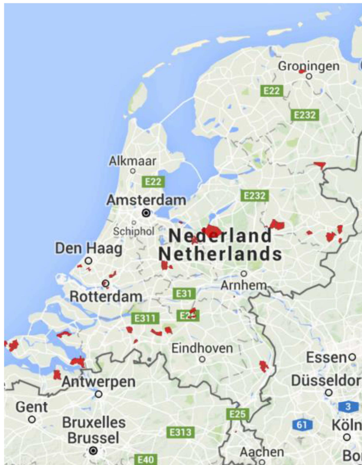
Afbeelding 1: Overzicht uitrolgebieden slimme meter, 4 e kwartaal 2015

In het laatste kwartaal van 2015 is de eerste meting van de consumentenmonitor uitgevoerd. 38 De huishoudens die in het laatste kwartaal van 2015 een slimme meter aangeboden hebben gekregen, vormen daarmee het vertrekpunt van de marktvaagmonitor tijdens de grootschalige uitrol van de slimme meters tot 2020. Onderstaand is te zien in welke gebieden de aanbidding van de slimme meters het 4 e kwartaal van 2015 heeft plaatsgevonden.