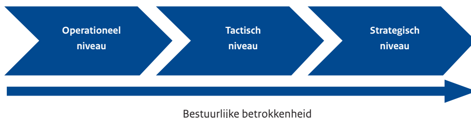
Schema: Schaal van bestuurlijke betrokkenheid op drie niveaus van samenwerking

Hoe strategischer, hoe meer bestuurlijke aandacht er zou moeten zijn. Hoe meer ook de identiteit van de gemeente in het geding is.