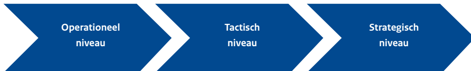
Schema: Drie niveaus van samenwerking

Schematisch zien de drie niveaus van samenwerking er als volgt uit: